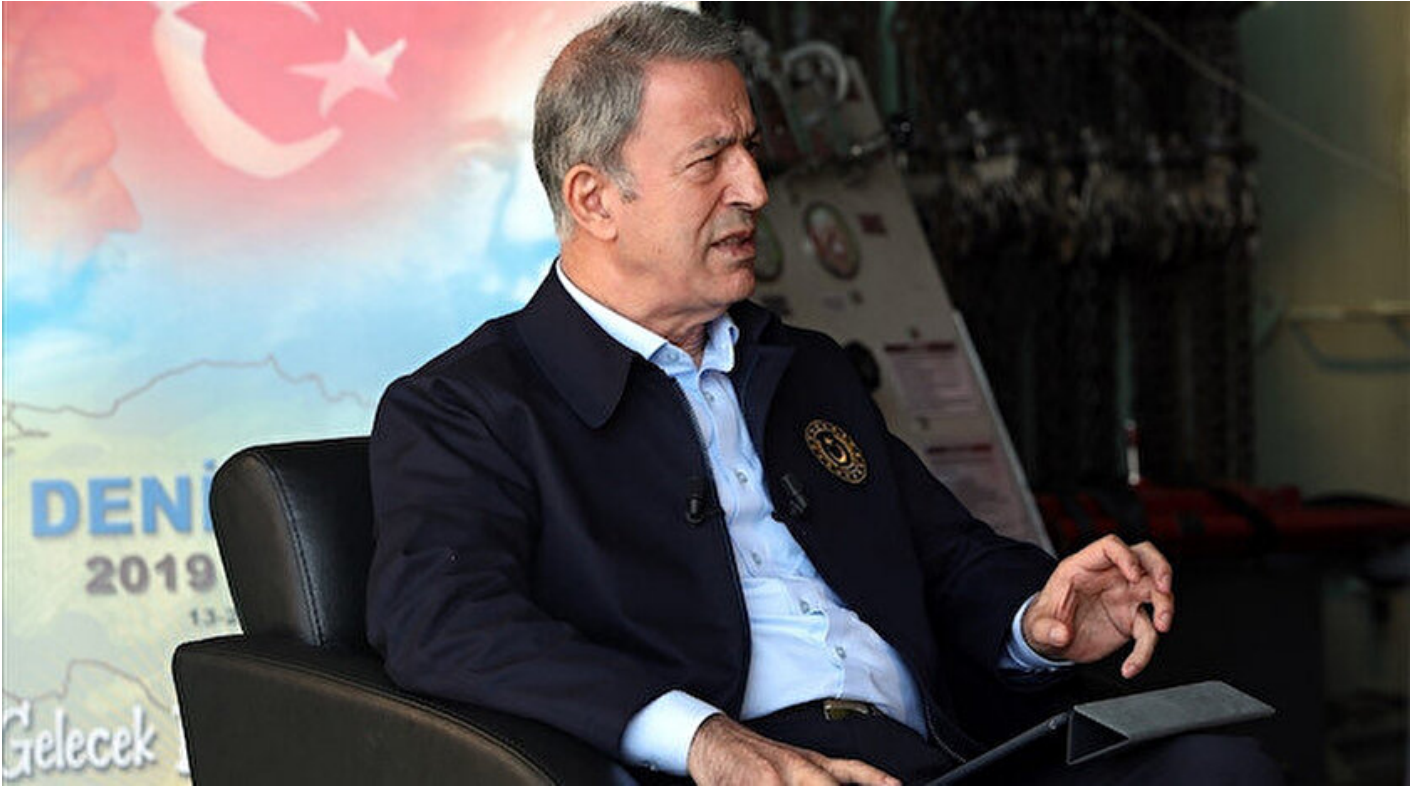
Millî Savunma Bakanı Hulusi Akar