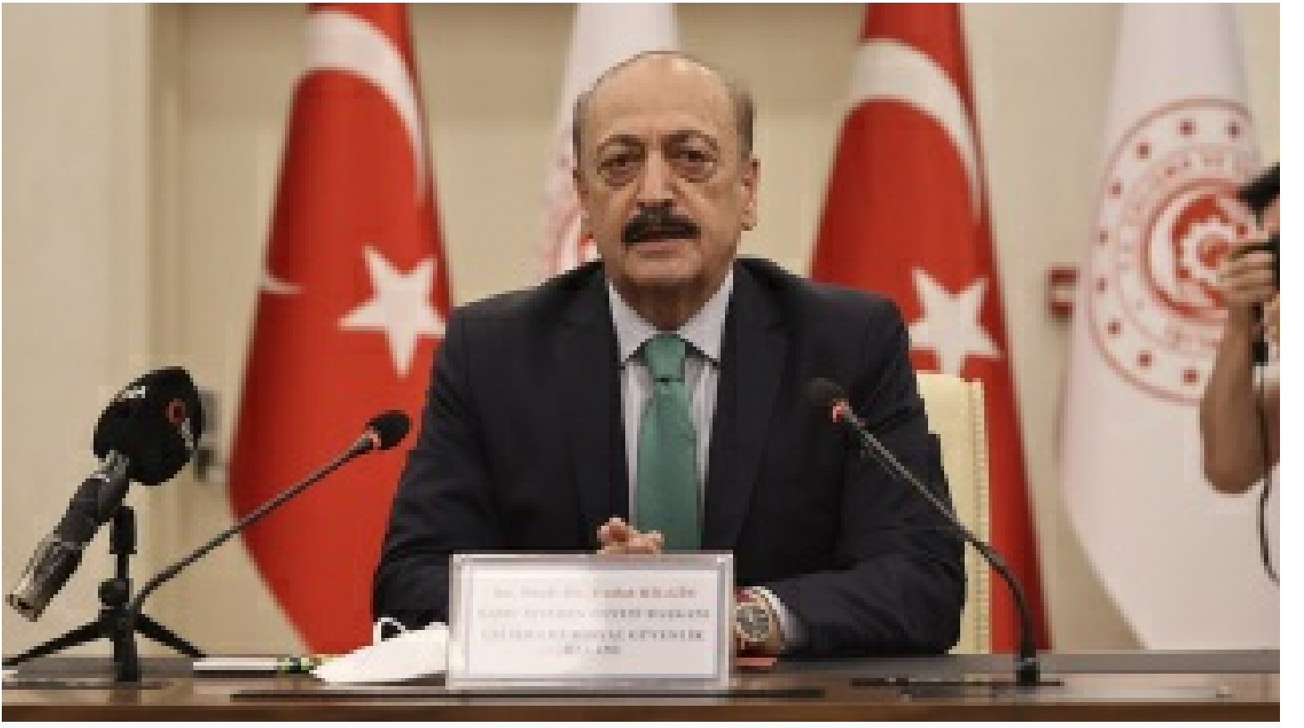
Bakan Bilgin: Türk devleti ilacın parasına bakmaz