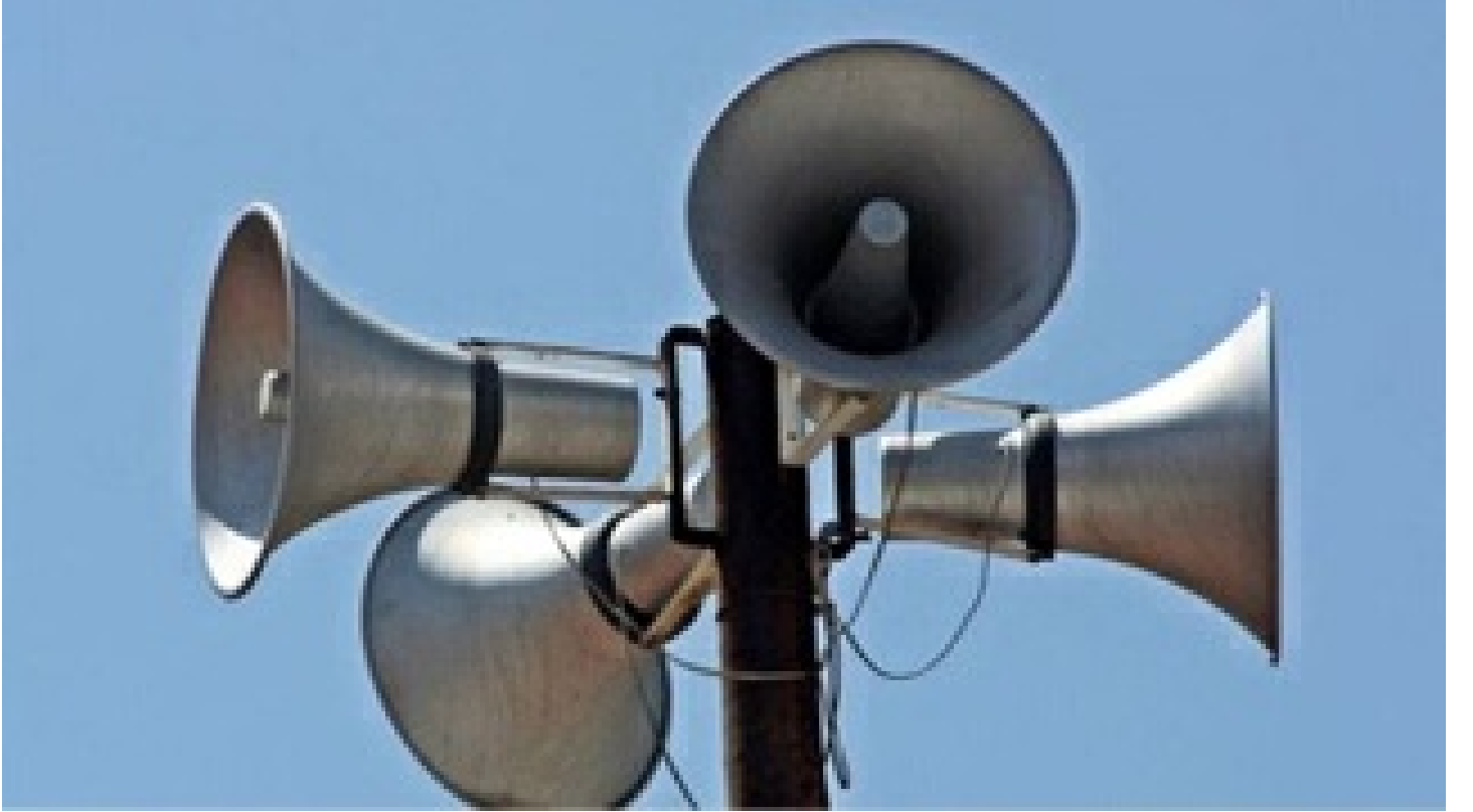
Siren neden çalıyor? Siren sesleri nereden geliyor?