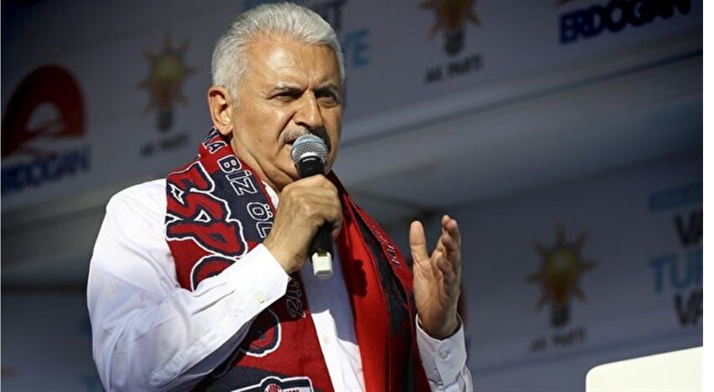
AK Parti Genel Başkanvekili ve Başbakan Binali Yıldırım

Haber Merkezi · 12 Haziran 2018, 18:55 · Son Güncelleme: 12 Haziran 2018, 19:03 · AA