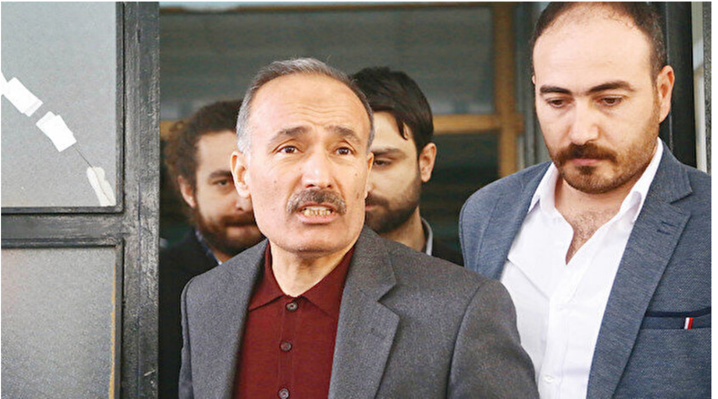
Emniyet İstihbarat Daire Başkanı Ramazan Akyürek