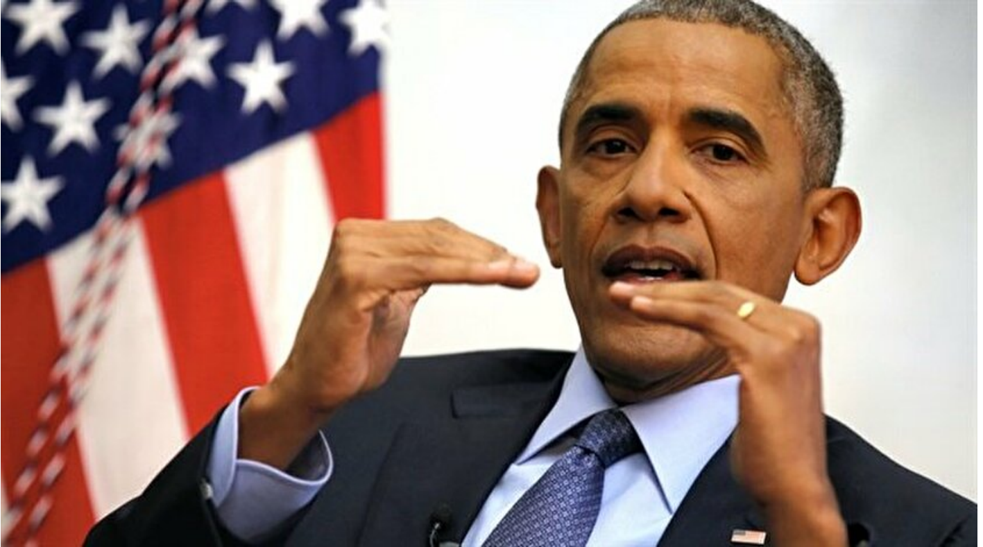
ABD Başkanı Barack Obama

Haber Merkezi · 07 Ocak 2017, 12:45 · Son Güncelleme: 07 Ocak 2017, 12:54 · AA