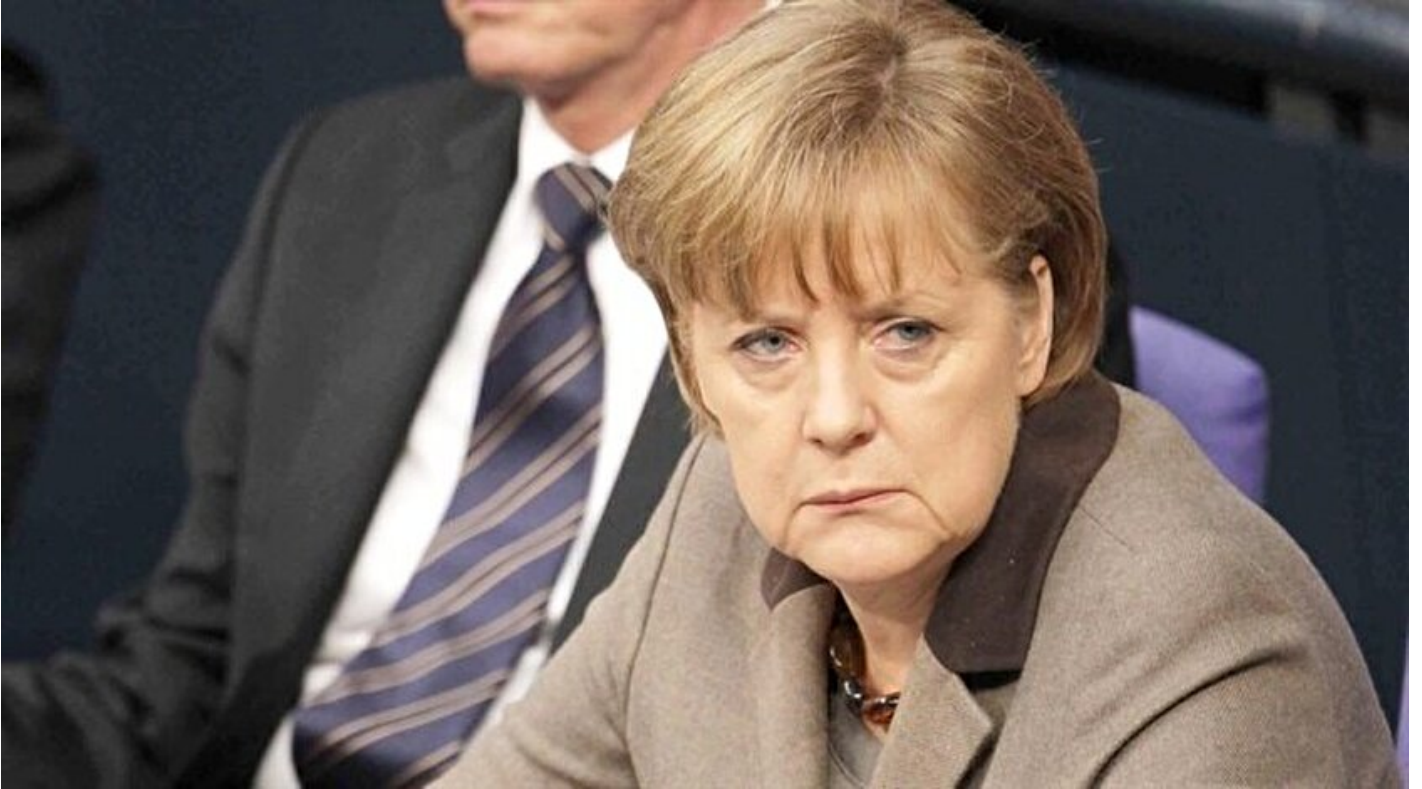
Almanya Başbakanı Angela Merkel

Haber Merkezi · 23 Eylül 2017, 04:00 · Son Güncelleme: 23 Eylül 2017, 04:30 · Yeni Şafak