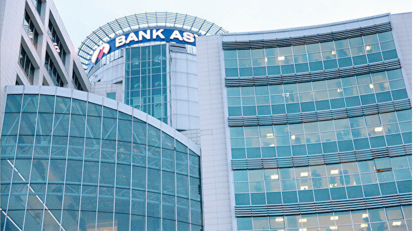
Bank Asya (Arşiv)

Osman Özgan · 18 Şubat 2019, 04:00 · Son Güncelleme: 18 Şubat 2019, 10:35 · Yeni Şafak