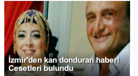
İzmir'den kan donduran haber! Cesetleri bulundu

Etiketler : Yavuz Sultan Selim Han'ın kaftanı, fetö,