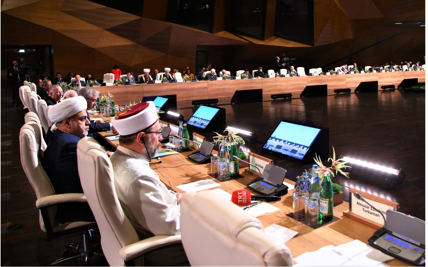
Dünya Dini Liderleri 2. Bakü Zirvesi

İnsanların inancını tartışmadan, sorgulamadan, ihtiyaçlarını, acılarını, haklarını konuşmaları gerektiğini dile getiren Erbaş, "Nitekim fakirlik, ayrımcılık, gelir dağılımında adaletsizlik, çevre sorunları gibi meseleler dünyadaki herkesin etkilendiği ortak sorunlardır. Bizler Müslüman dini liderler olarak bütün insanları kucaklayacak bir adalet ve merhamet duygusunu kökleştirmek, inançların istismar edilmesini engellemek ve özellikle din üzerinden terör ve anarşi oluşturulmasına engel olmak için ciddi çalışmalar yapmak zorundayız." ifadelerini kullandı.