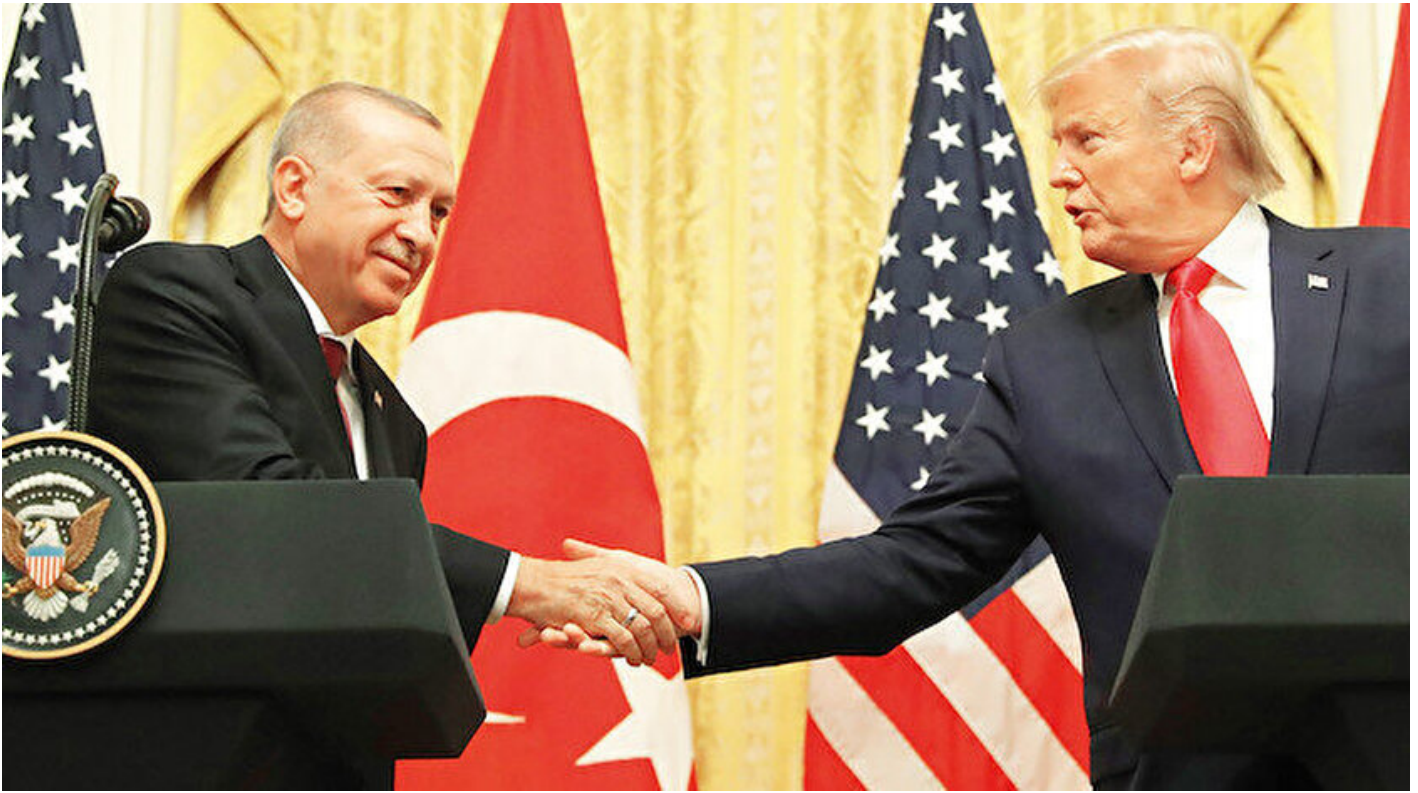
Cumhurbaşkanı Erdoğan ve Donald Trump