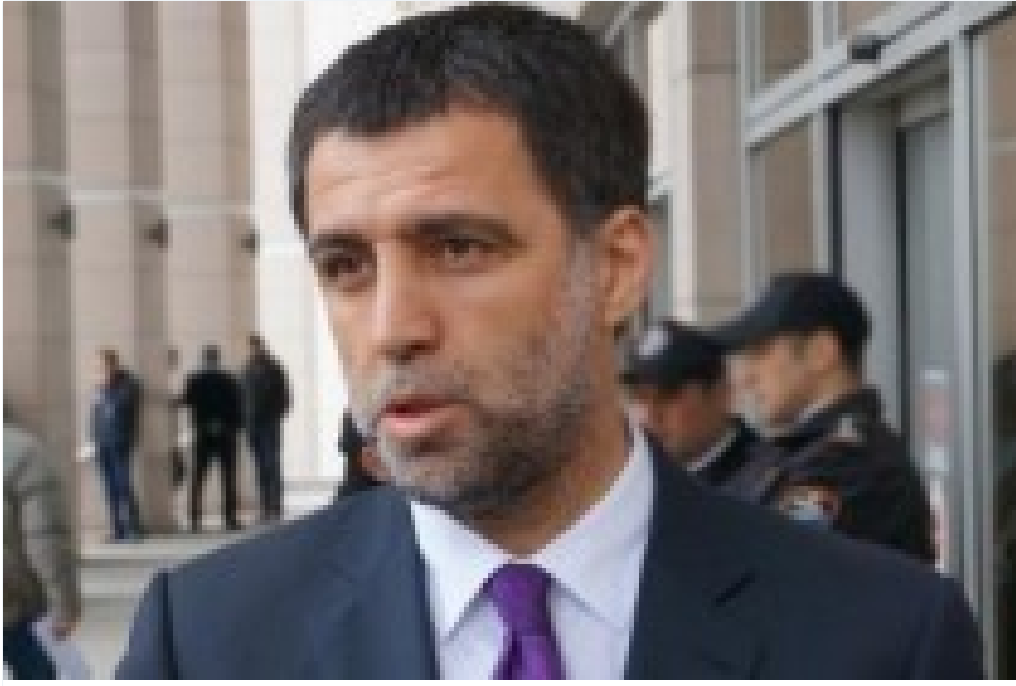
FETÖ'cü Hakan Şükür İtiraf Etti: 'Tüm Birikimimizi Kaybettik'