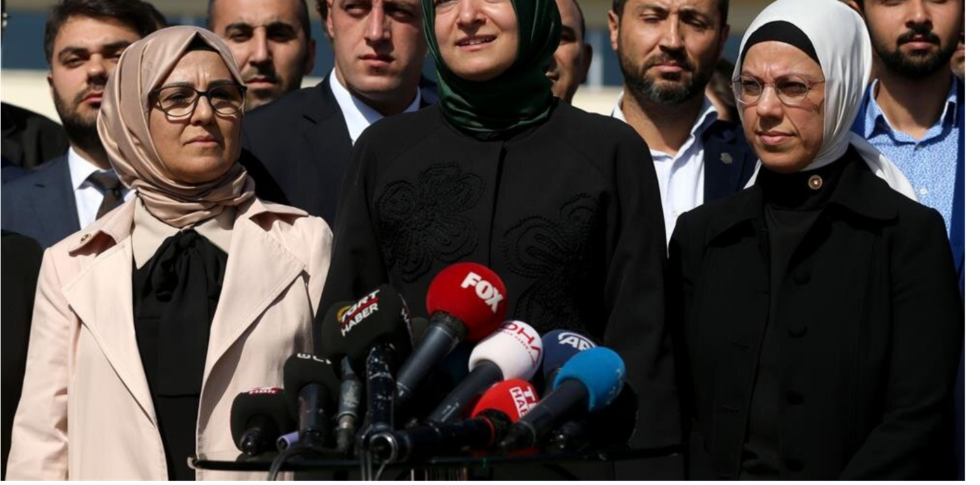
Fatma Betül Sayan Kaya, Aile Bakanı.