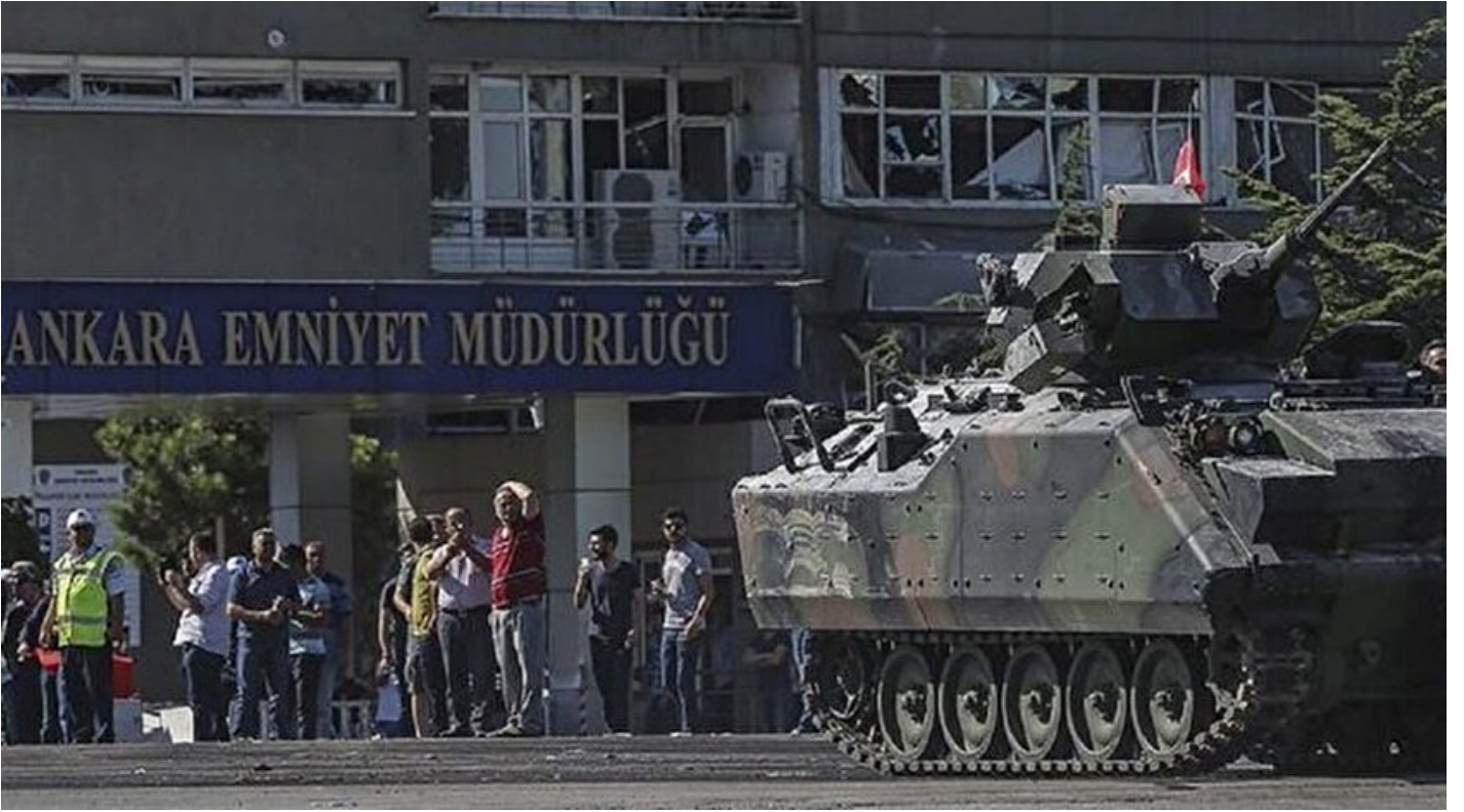
Ankara Emniyet Müdürlüğü