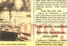
Bakırköy kaymakamı... yeni polis müdürü olarak tayin edildi.