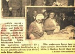
"İpekiş" dün açıldı. Dün satış yapılmamasına rağmen Vali Bey bir gömlek mübayaasında ısrar etmiş ve bu suretle İpekiş'in ilk müşterisi olmuştur.

Dün satış yapılmamasına rağmen Vali Bey bir gömlek mübayaasında ısrar etmiş ve bu suretle İpekiş'in ilk müşterisi olmuştur