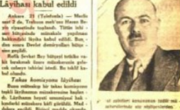
Meclis kanununun tadilini harareti bir müzakereden sonra kabul etti.

Meclis kanununun tadilini harareti bir müzakereden sonra kabul etti