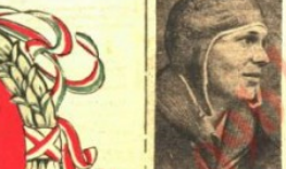
Çoktan önce İtalya'da uçmuş olan, şimdi İrlanda'da yere inen Amelia Earhart.