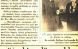
Balkan ticaret odasının Balkan haftası.

den iki gün tehir edildi, varın hasıyâ... Balkan ticaret odasının Balkan haftası.