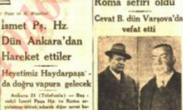
İsmet Paşa'nın Ankara'dan hareket ettiği an.

Heyetimiz Haydarpaşa'da doğru vapura gelecek