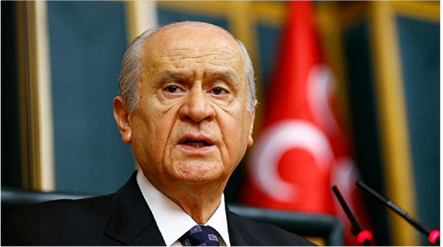
MHP Genel Başkanı Devlet Bahçeli