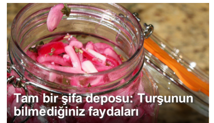
Tam bir şifa deposu: Turşunun bilmediğiniz faydaları