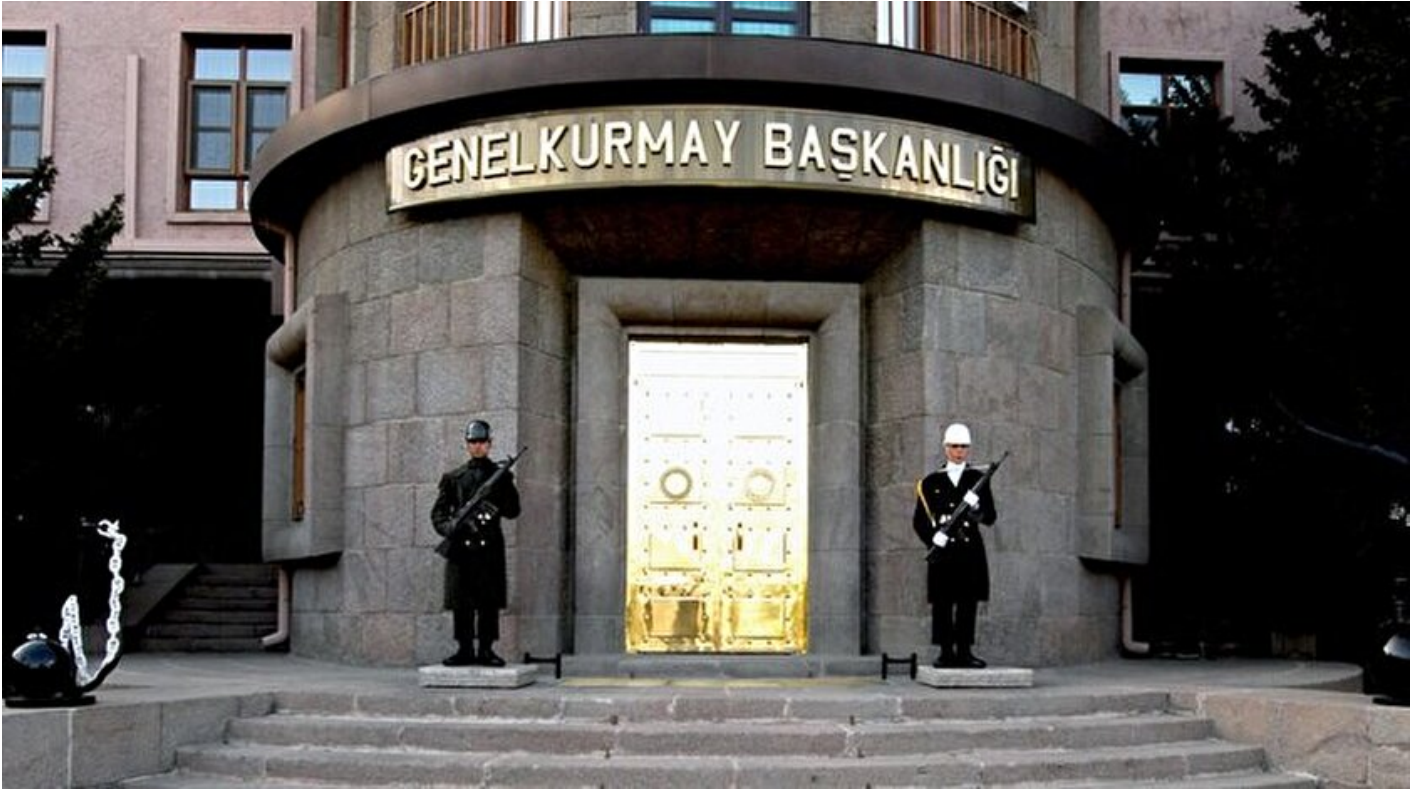
Genelkurmay Başkanlığının "darbe" raporu

Haber Merkezi · 02 Mart 2017, 18:23 · Son Güncelleme: 02 Mart 2017, 18:25 · AA