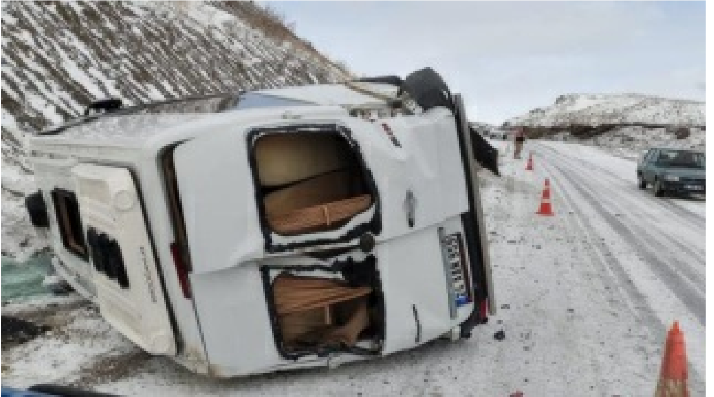
Erzincan'da devrilen minibüsteki 8 kişi yaralandı