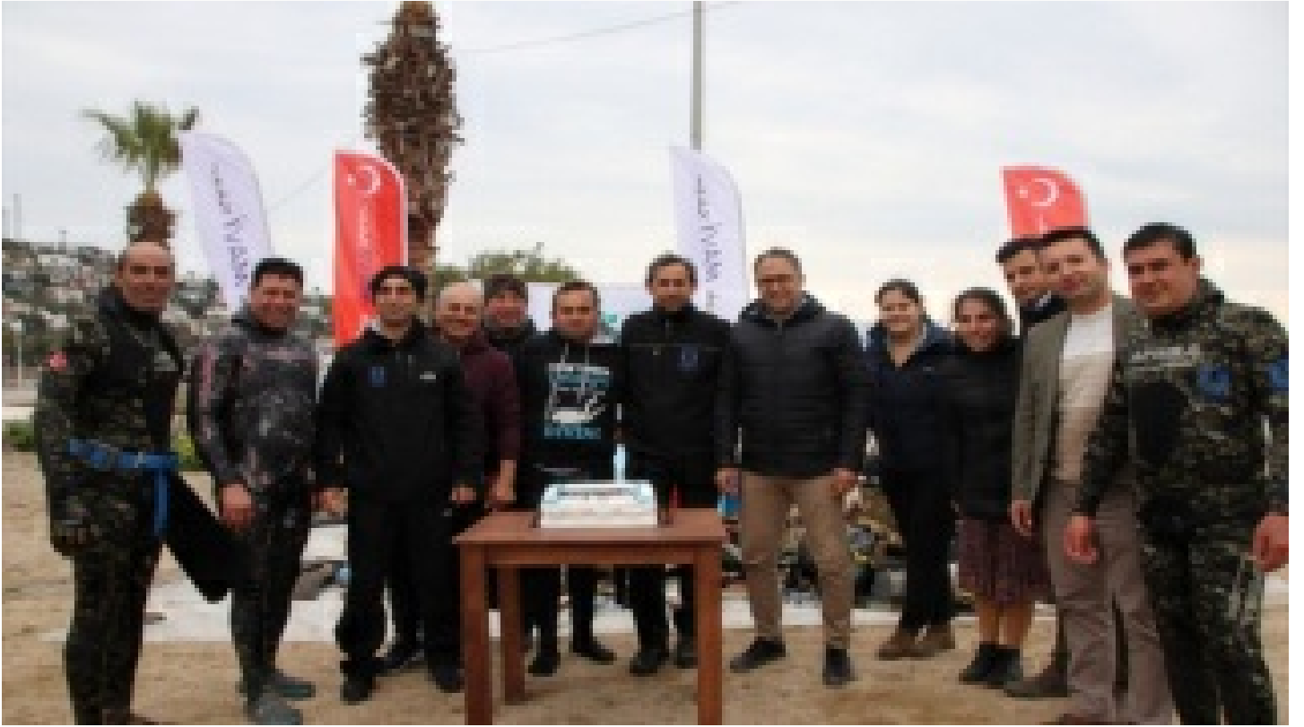
Dalgıçlar denizi, öğrenciler kıyıyı temizledi