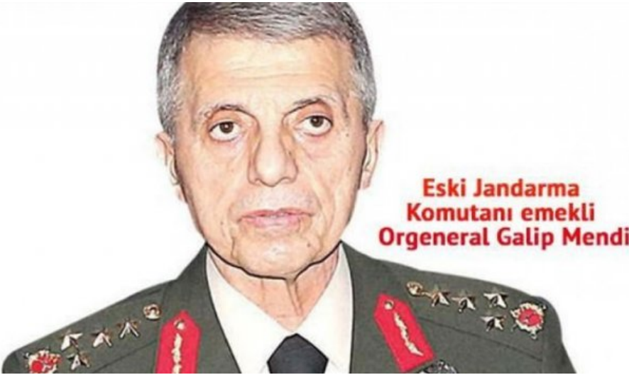
Eski Jandarma Komutanı emekli Orgeneral Galip Mendi

03.06.2017 - 16:04 | Son Güncelleme: 03.06.2017 - 16:10