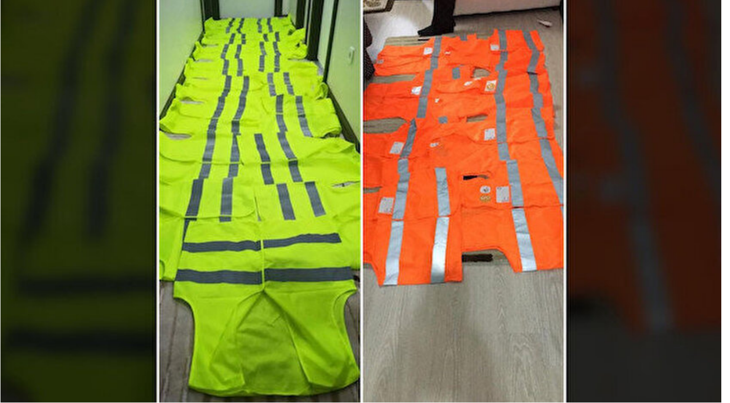
Bursa'da FETÖ'nün gaybubet evinde ele geçirilen sarı ve turuncu yelekler