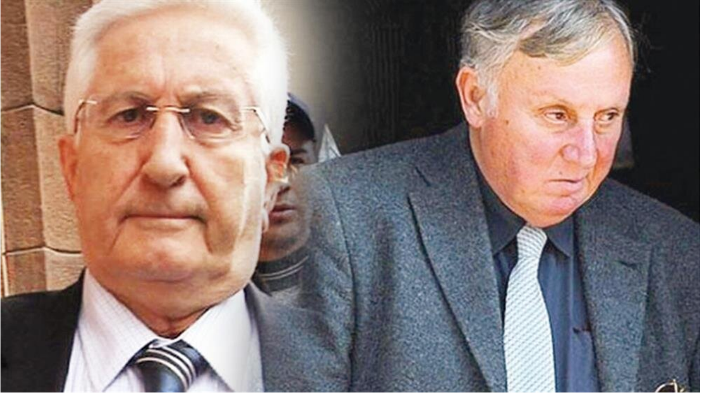
Çevik Bir - Çetin Saner

FETÖ davalarında örgüt üyelerinin dahi tutuklandığına işaret eden Avukat Cüneyt Toraman, “Ancak müebbet hapis ile yargılanan 28 Şubat’ın mimarları ellerini kollarını sallaya sallaya dışarıda dolaşiyor” dedi. Bunun hukuk alanında da büyük bir çelişki oluşturduğunu kaydeden Av. Toraman, “Artık bütün deliller toplandı. Burada 60 sanık yargılanıyor. Ağırlaştırılmış müebbet hapis istenen bu kişiler de FETÖ’cü örgüt yöneticileri gibi yurtdışına kaçabilir. 20 avukat bir araya gelerek bu sanıkların kaçma ihtimallerine karşı yakalama kararı çıkarılmasını talep ettik” diye konuştu.