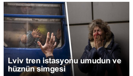
Lviv tren istasyonu umudun ve hüznün simgesi