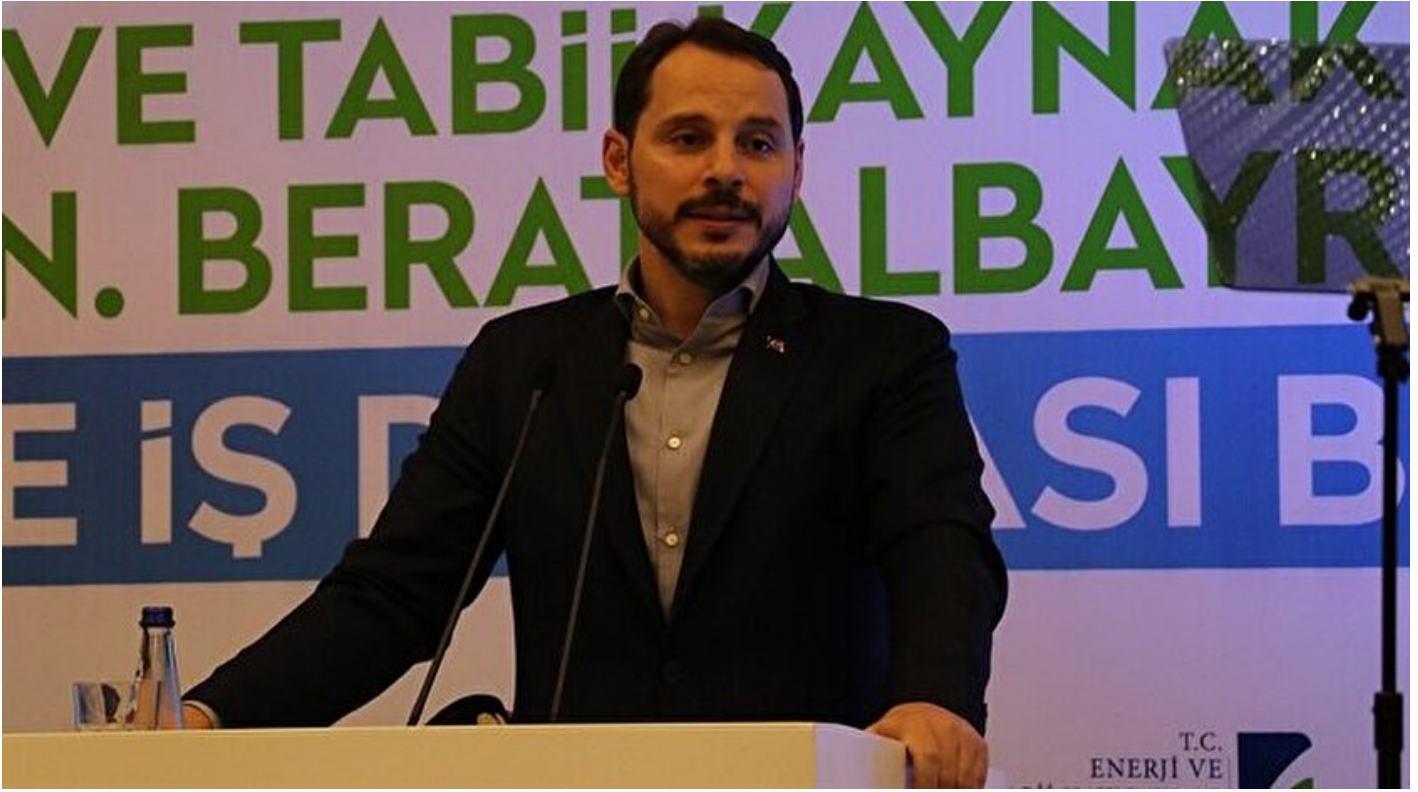
Enerji ve Tabii Kaynaklar Bakanı Berat Albayrak

Haber Merkezi · 09 Haziran 2018, 19:56 · Son Güncelleme: 09 Haziran 2018, 20:10 · AA