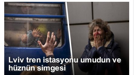
Lviv tren istasyonu umudun ve hüznün simgesi