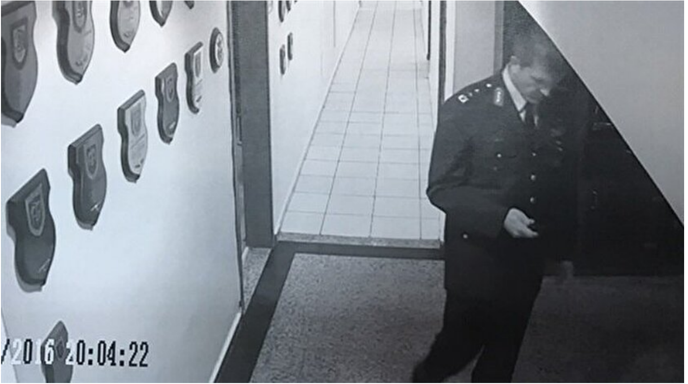
Tören kıyafetiyle Akıncı'da