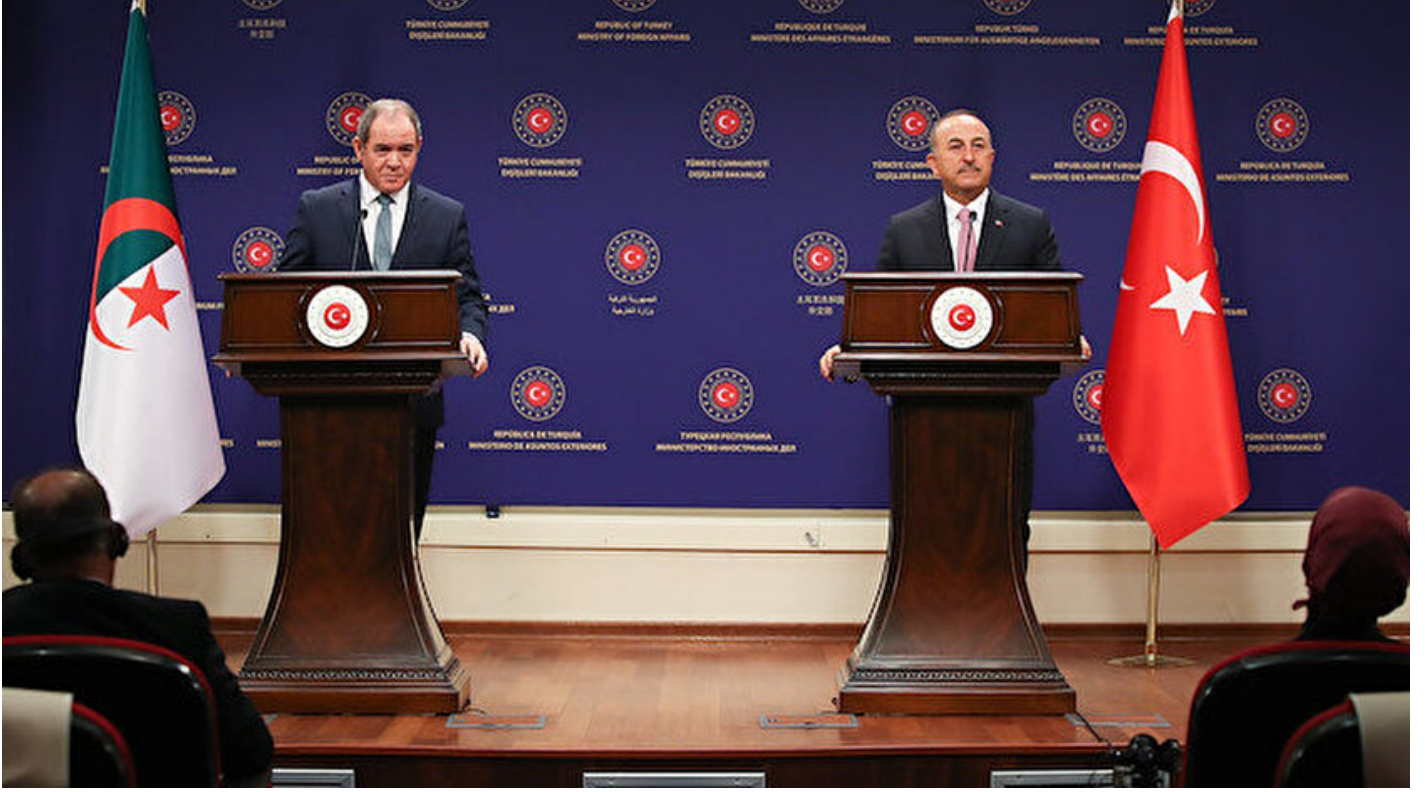
Dışişleri Bakanı Mevlüt Çavuşoğlu ve Cezayirli mevkidaşı Sabri Bukadum.

Haber Merkezi · 01 Eylül 2020, 12:28 · Son Güncelleme: 01 Eylül 2020, 17:25 · AA