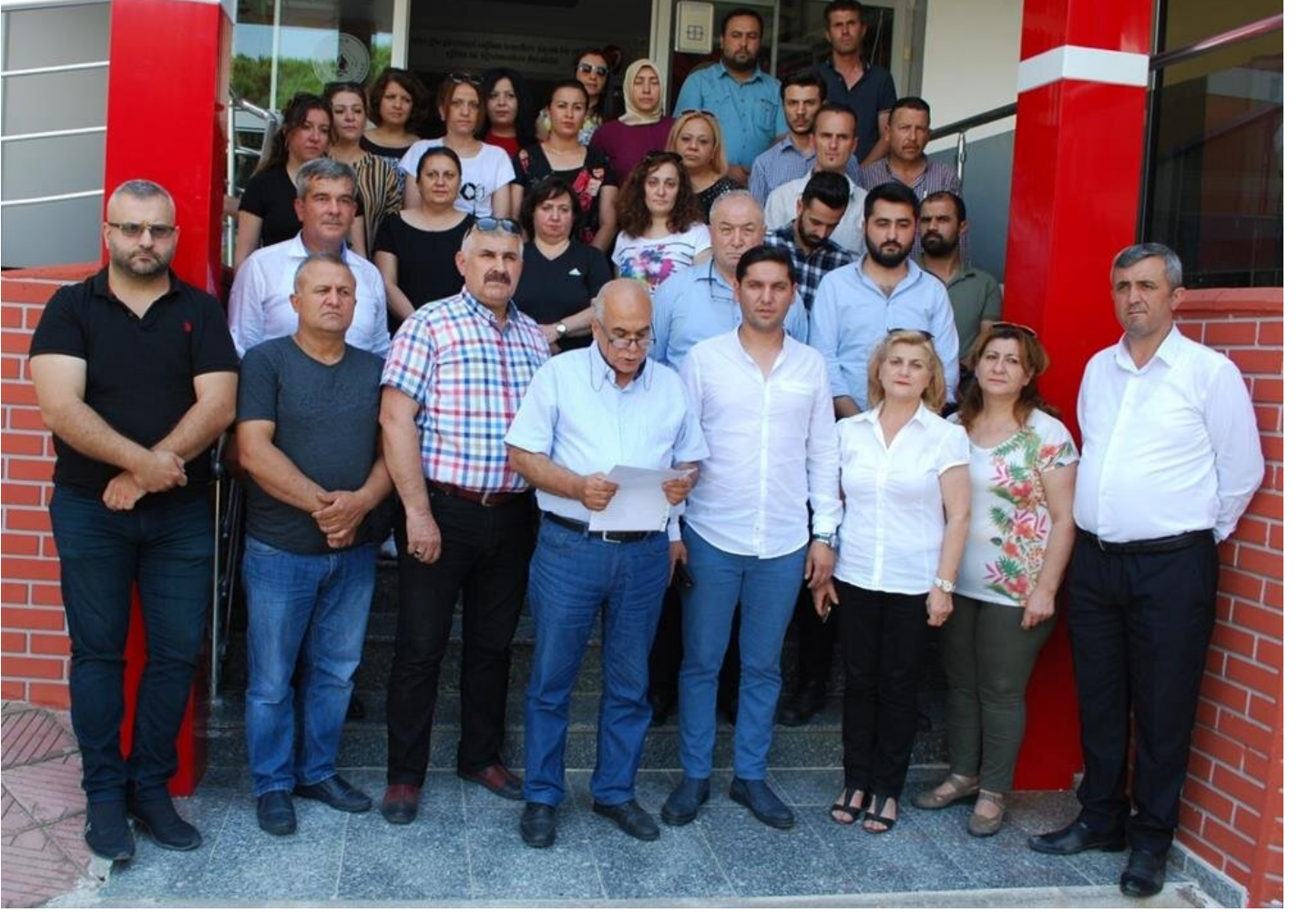
Manisa'nın Salihli ilçesinde İP'ten, 7'si ilçe başkan yardımcısı 34 partili toplu halde istifa etmişti.