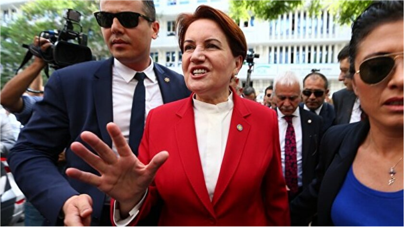
İP Genel Başkanı Meral Akşener