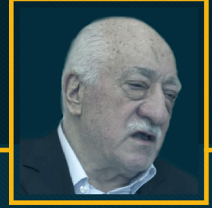
Fetullahçı Terör Örgütü elebaşı FETULLAH GÜLEN