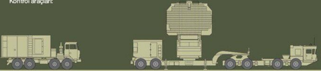
55K6E Muharebe Kontrol Mekanizması