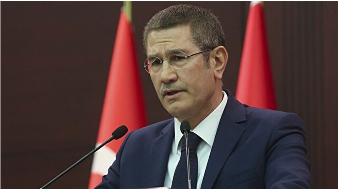
Milli Savunma Bakanı Nurettin Canikli

Haber Merkezi · 22 Kasım 2017, 11:38 · Son Güncelleme: 22 Kasım 2017, 13:26 · Diğer