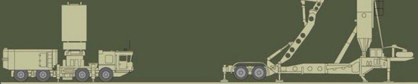
RLS 979L6E radar