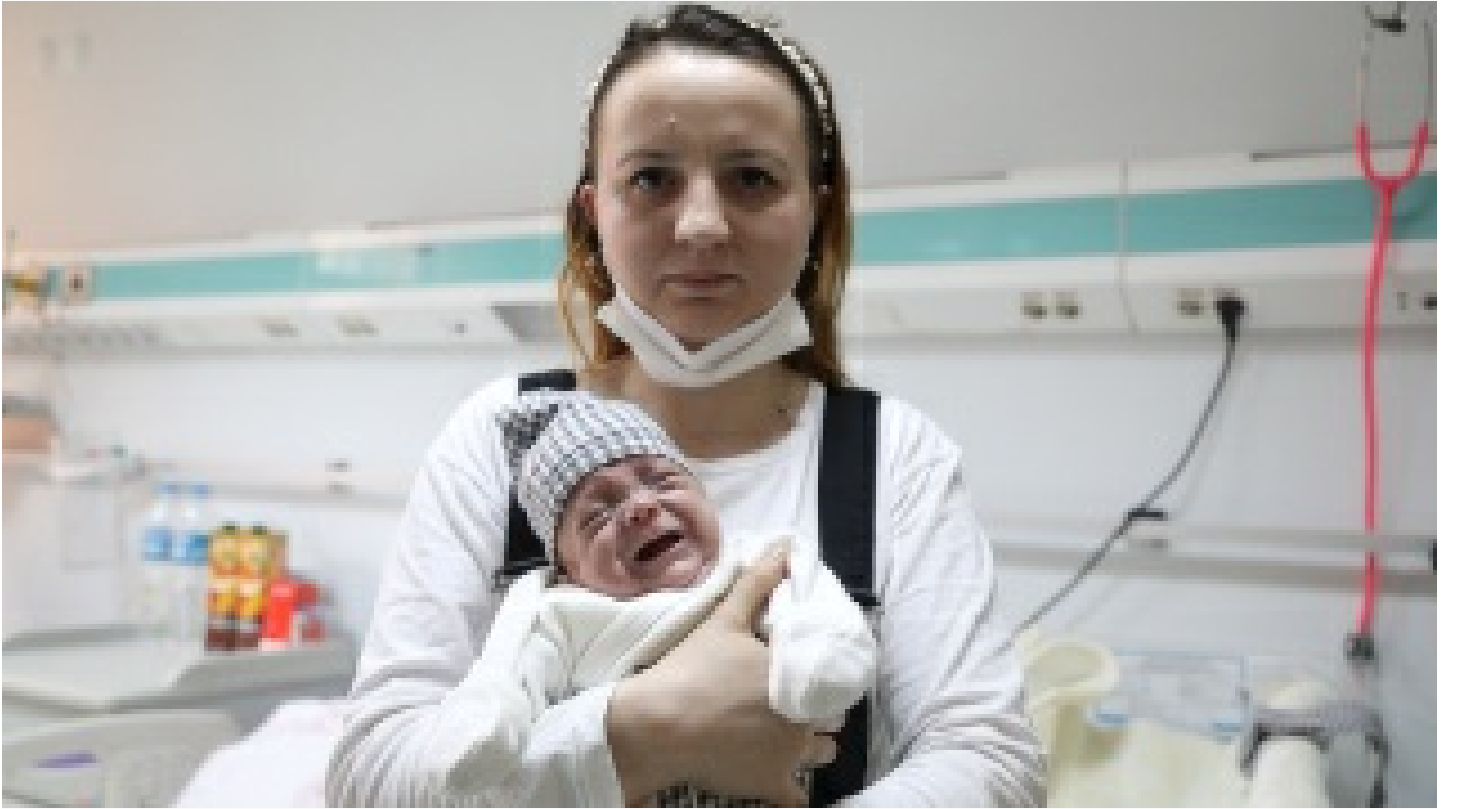
Hayata 600 gramla başladı