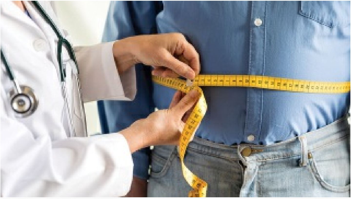
Kovid-19 salgını obeziteyi de artıracak