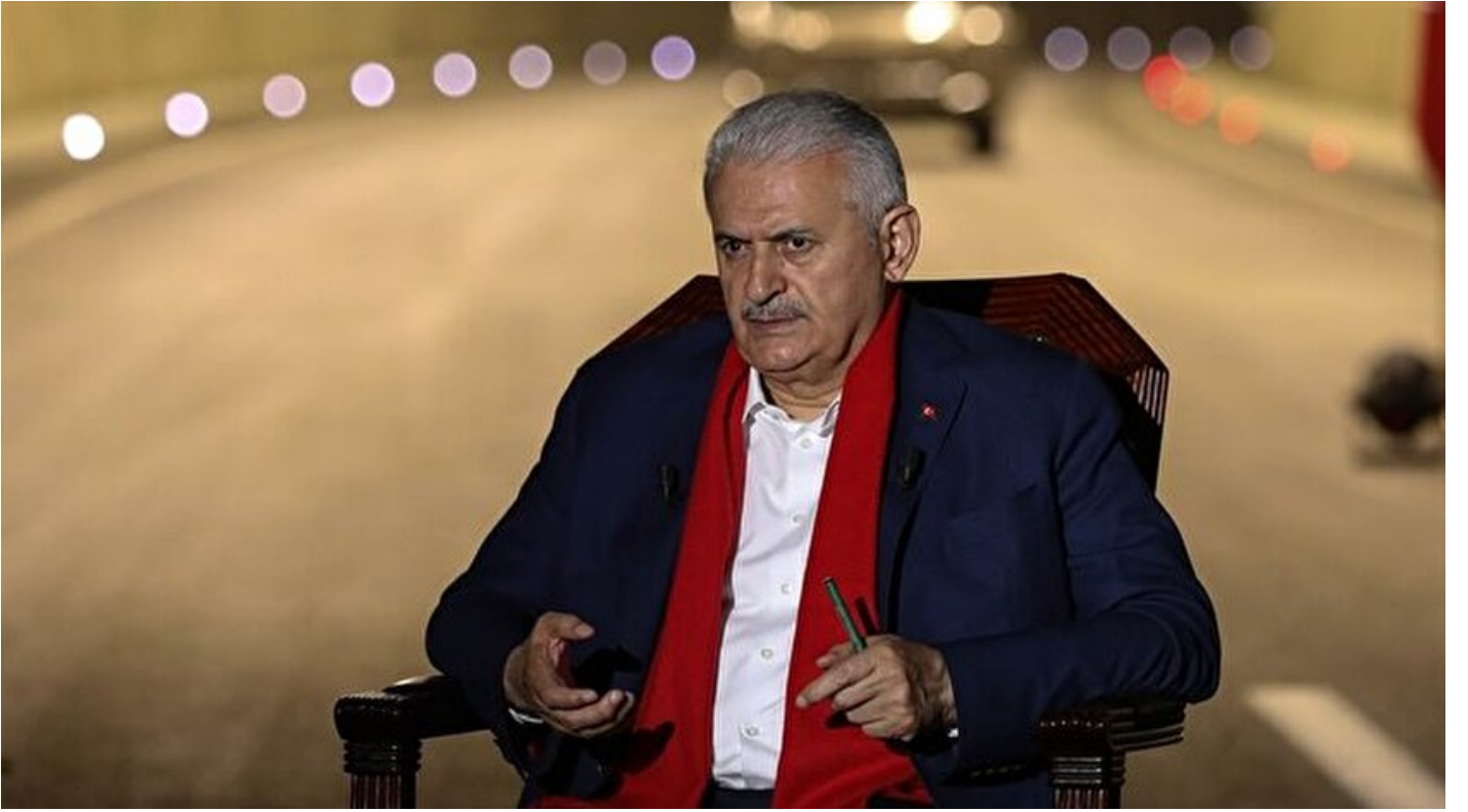
Başbakan Binali Yıldırım

Haber Merkezi · 11 Haziran 2018, 22:05 · Son Güncelleme: 12 Haziran 2018, 01:28 · AA