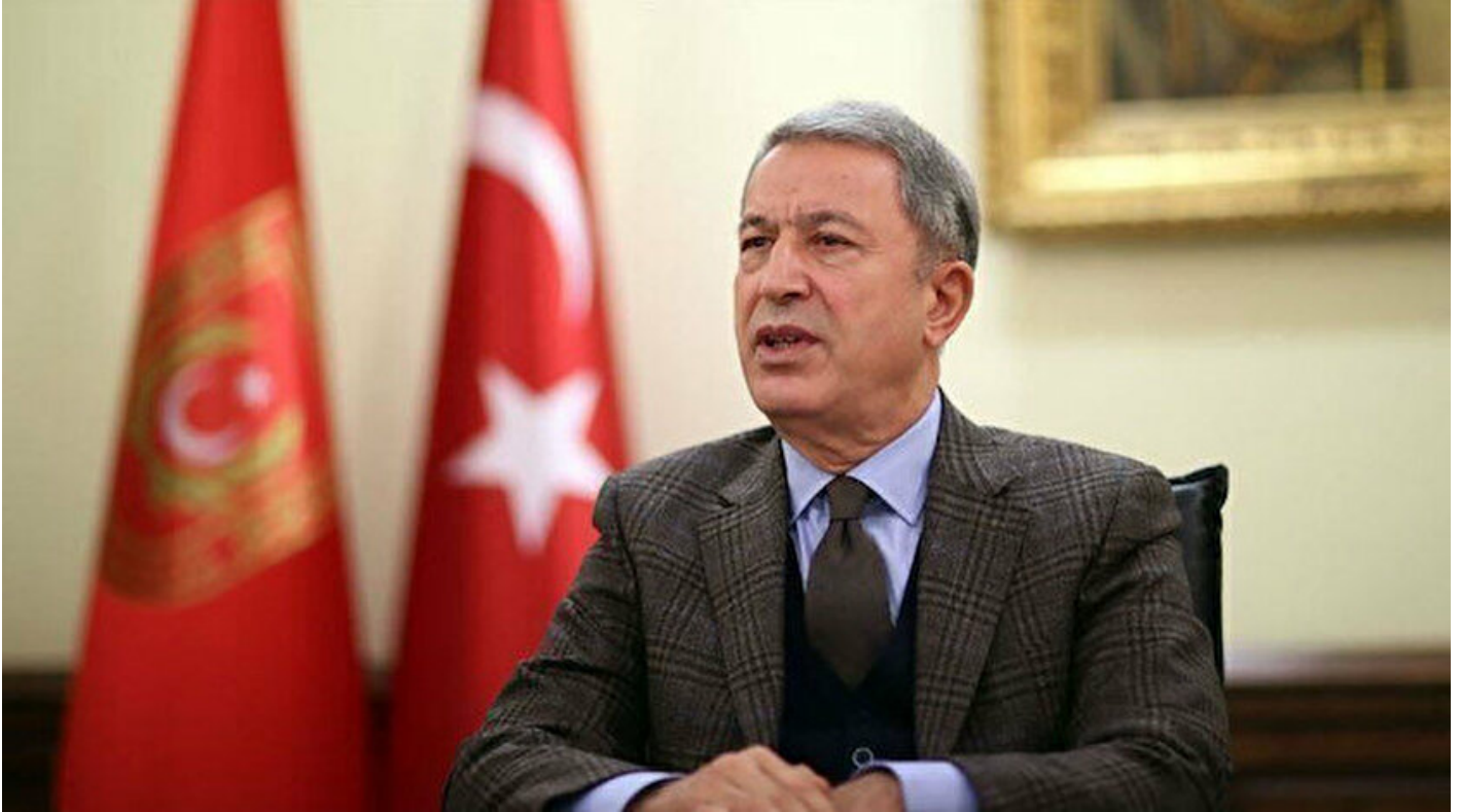
Milli Savunma Bakanı Hulusi Akar