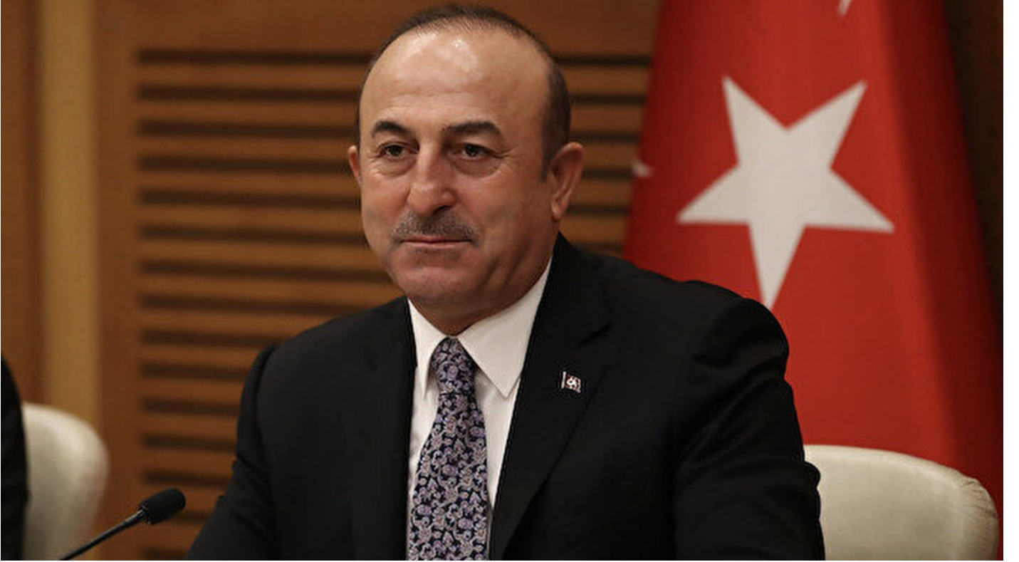
Dışişleri Bakanı Mevlüt Çavuşoğlu

Haber Merkezi · 02 Ocak 2019, 21:21 · Son Güncelleme: 02 Ocak 2019, 21:28 · DHA