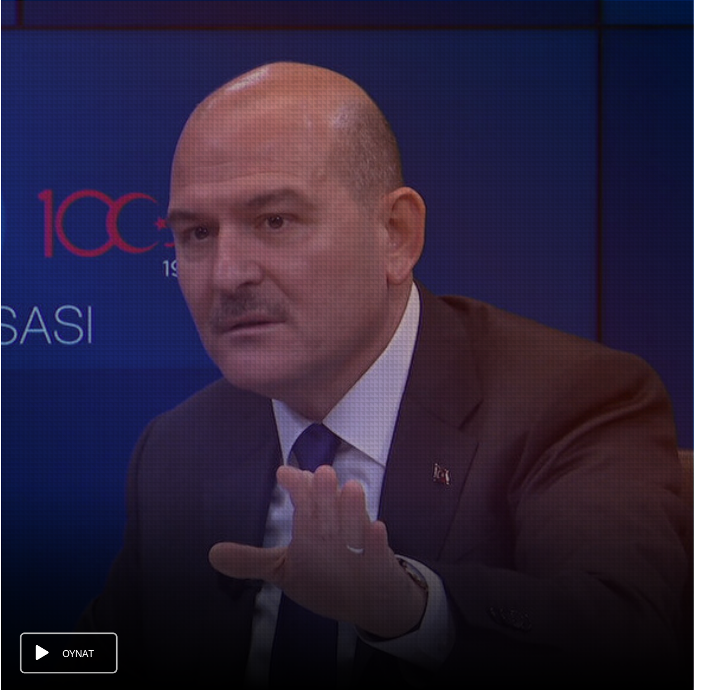
Soylu'dan Abdullah Gül'e 'gezi' eleştirisi

'Gezi olaylarının tam göbeğindeydim, o gün AK Parti AK-GE Başkanı Tarımciydim, sosyal medyada, orada neler olup bittiğini biliyorum. İnsanları durdurdular, kıyafetlerine göre arabalarından indirdiler, bu ülkenin bugünkü Cumhurbaşkanına küfür ettirdiler. Peki o gün Cumhurbaşkanı yaptınız, bu olayları görmediniz mi, bu olayları yaşamadınız mı? Tarihi doğru koymak zorundayız. Eğer tarihi yanlış şekilde çarpıtmak üzere ortaya konulan bir cümle varsa benim görevim fert olarak onu düzeltmektir. Ben düzeltirim, kim ne söylese söylesin. Suçluyorum tabii, tespitlerim var. Sayın Cumhurbaşkanımıza hiçbirisi kuvvetle güç vermedi, Cumhurbaşkanımızı tek başına havalimanına indirmeye çalıştılar. 'Kimse karşılaşsın, aman bu işleri gerginleştirmeyelim, bu işleri büyütmeylem, orada demokratik bir eylem ortaya koyuluyor, söndürmeye çalışalım'. Yok öyle bir şey. O tarihte beraber yaşadığımız arkadaşlar hep beraber biliyorlardı, Sayın Cumhurbaşkanımızı mazlum bir şekilde İstanbul'a indirmeye çalıştılar. Tek başına evine gidecek oturacaktı, ondan sonra istedikleri gibi eğlemleri yöneteceklerdi, istedikleri gibi Türkiye'yi bir hale getireceklerdi. Dolmabahçeyi basacaklar, orada koltuğa oturup pro içecekler, bütün hevesleri oydu."