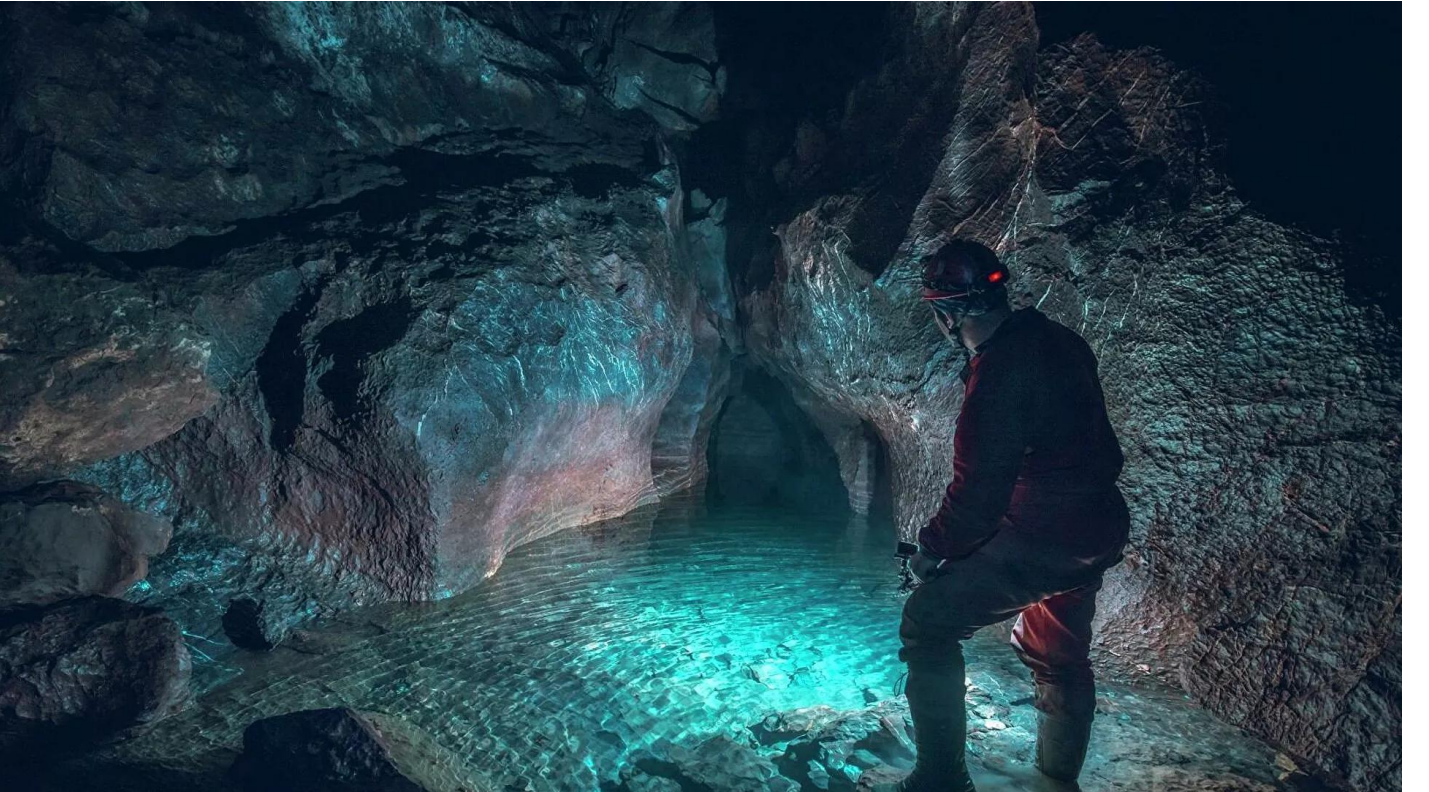
Sakın denemeyin! Yılan deliğinden geçti, gündem oldu Sosyal Medya