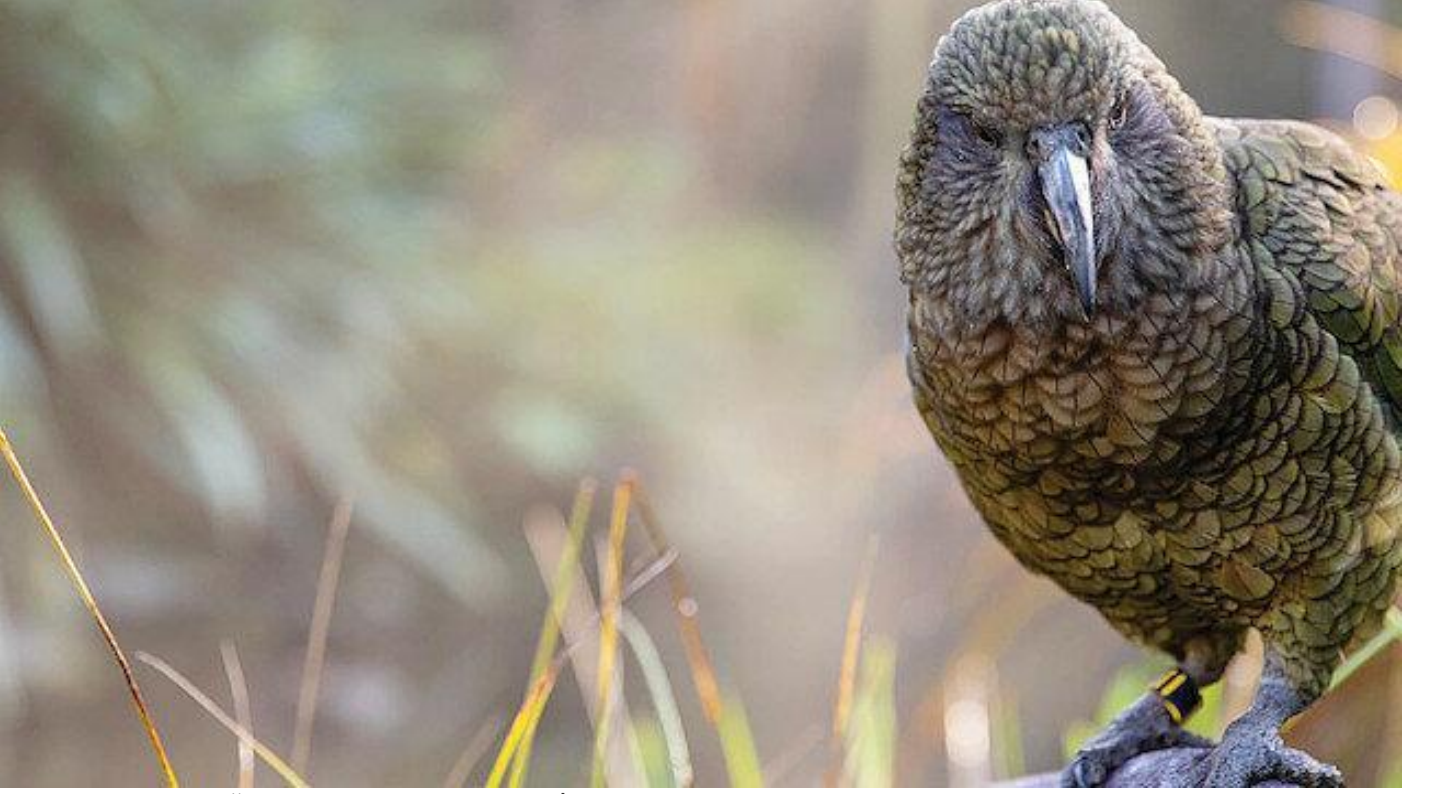
Kamerayı çalan papağan kaçış anını böyle kaydetti! Sosyal Medya