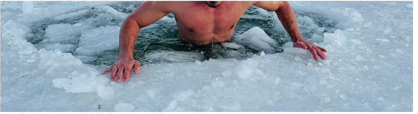
Youtuber buz tutmuş göle daldı, hipotermi tehlikesi geçirdi Sosyal Medya