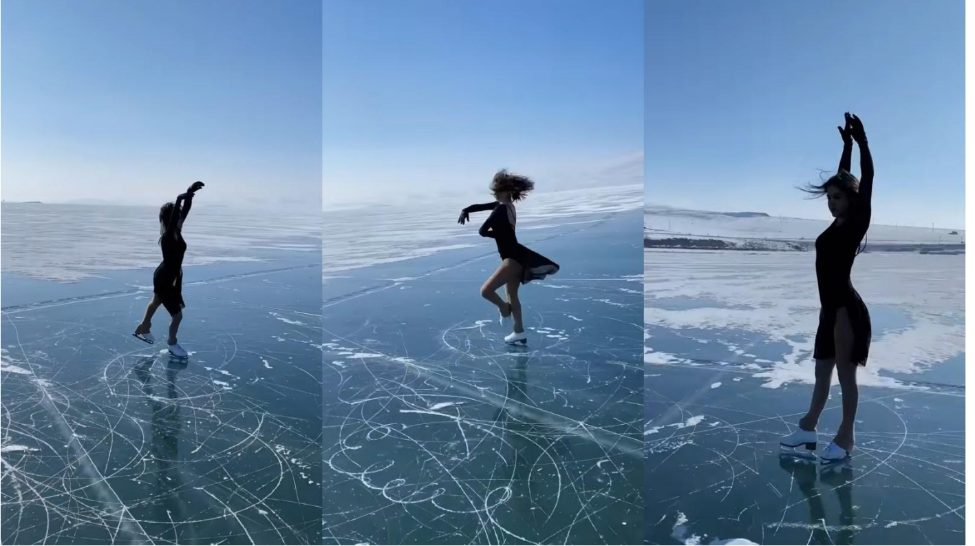
Milli sporcudan ıldır Gölü'nde buz pateni gösterisi Sosyal Medya