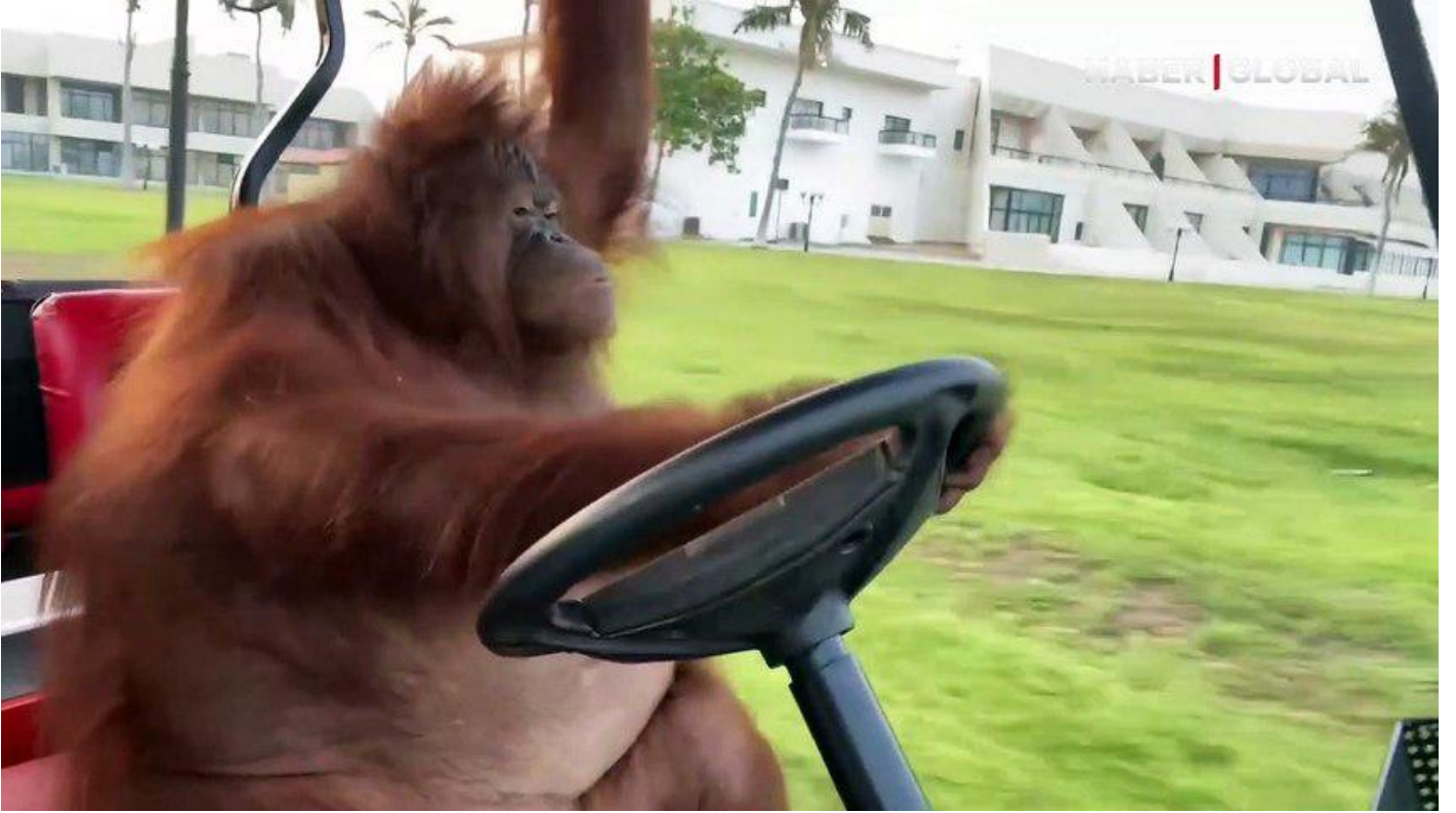
Herkes onu konuştu! Golf arabası süren orangutan sosyal medyayı salladı Sosyal Medya