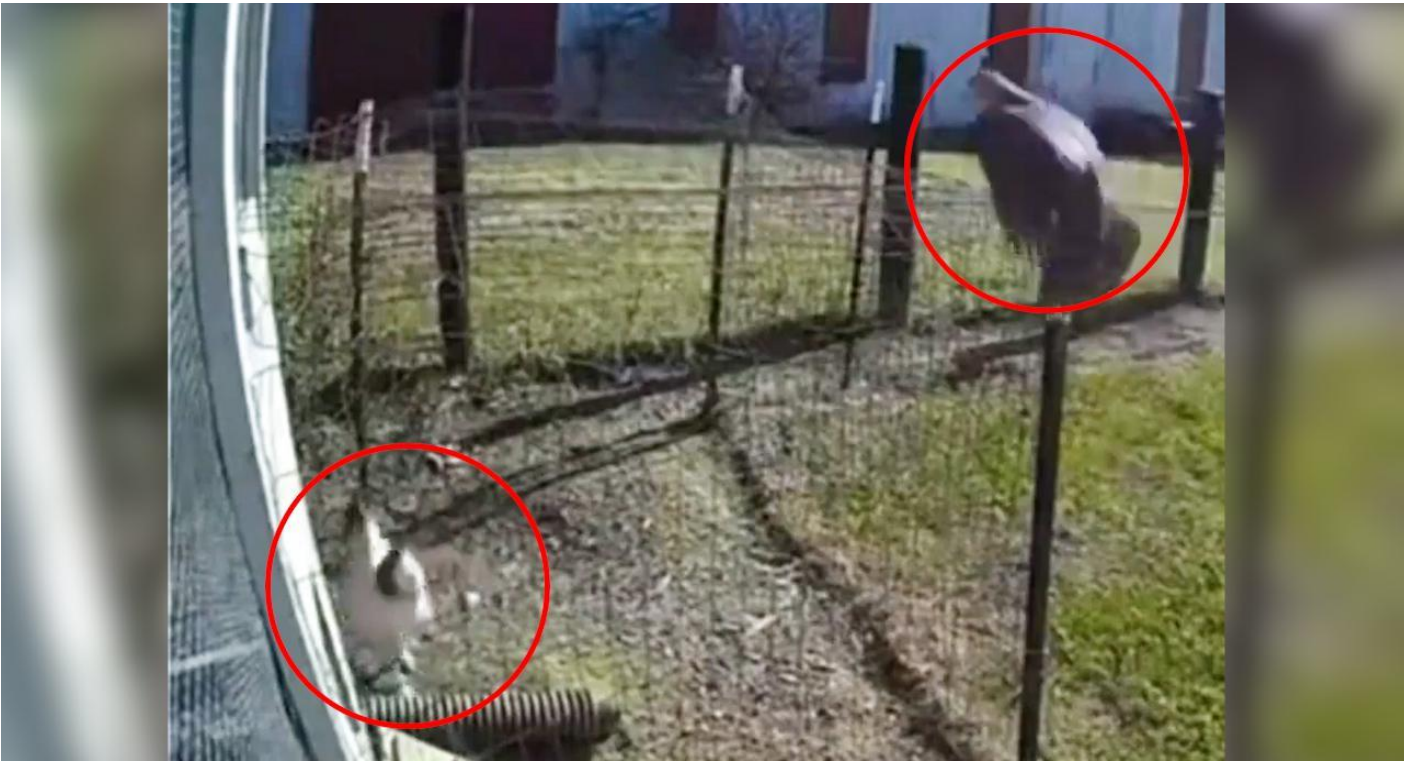
Tavuđu avlamaya gelen řahin horozla kavgaya tutuřtu Sosyal Medya