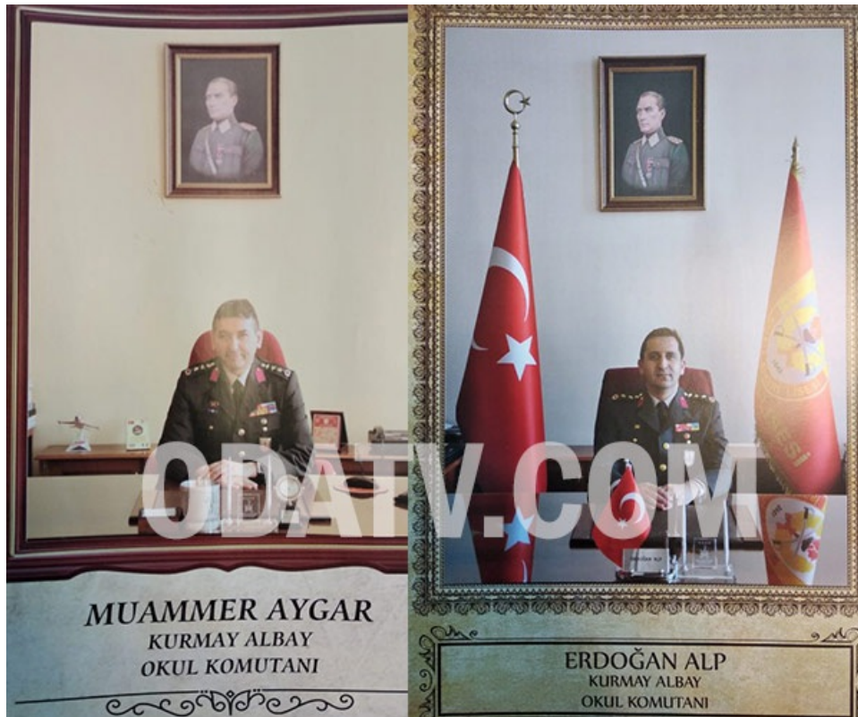
(Kuleli Askeri Lisesi yıllıklarında o komutanlar)