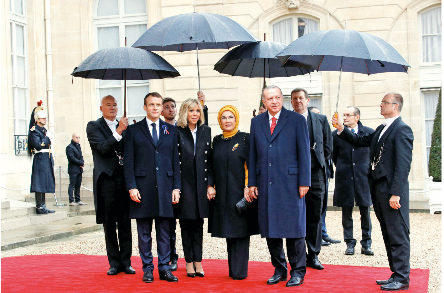
Cumhurbaşkanı Erdoğan ve eşi Emine Erdoğan'ı Elize Sarayı'nda Fransız mevkidaşı Emmanuel Macron ile eşi Brigitte Macron karşıladı.

“Son yıllarda Türkiye'nin güney komşuları Irak ve Suriye'de yaşanan iç karışıklıklar, artan terör tehdidi ve derinleşen istikrarsızlık ile Filistin'de on yıllardır şahit olduğumuz sistematik mülksüzleştirme ve yurtsuzlaştırma çabaları, bu durumun en somut göstergeleri arasındadır. Birinci Dünya Savaşı, dönemin büyük güçleri tarafından masa başında cetvelle çizilen sınırlar uyarınca birtakım sorunlu siyasi yapıların oluşumunu beraberinde getirmiştir. Dahası bu siyasi yapıların hükmettikleri toplumlarla güçlü bağlar kuramaması Ortadoğu ve Kuzey Afrika bölgelerinin 20. yüzyıl boyunca otoriter rejimler, askeri darbeler ve azınlık yönetimleriyle anılması sonucunu doğurmuştur. Dışlayıcı yapıları yıllarca destekleyenler Arap Baharı olarak adlandırılan demokratik halk hareketlerinin engellenmesi için de seferber oldular. Amaçlarına ulaşmak için askeri darbeler dahil her türlü anti-demokratik yönetime başvurular. Bu aktörler, karşı devrimci faaliyetlerini bugün de kararlılıkla sürdürmekte; küresel barış ve istikrarı kendi çıkarları uğruna tehlikeye atmaktadırlar.”