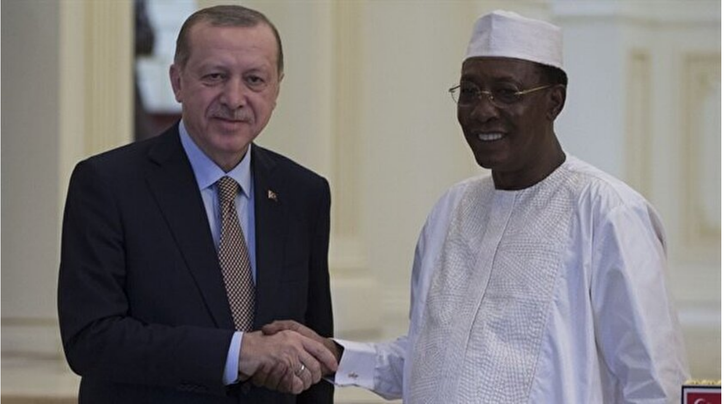
Cumhurbaşkanı Erdoğan ve Çad Cumhurbaşkanı Debi

Haber Merkezi · 27 Aralık 2017, 20:57 · Son Güncelleme: 27 Aralık 2017, 21:02 · AA