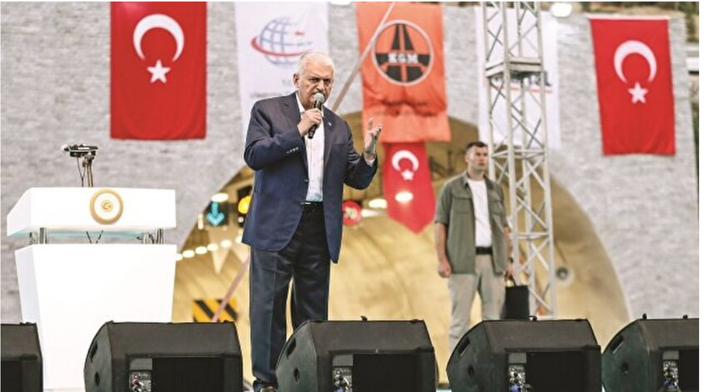
Başbakan Binali Yıldırım, AK Parti'nin Uşak mitinginde konuştu

Haber Merkezi · 12 Haziran 2018, 04:00 · Yeni Şafak