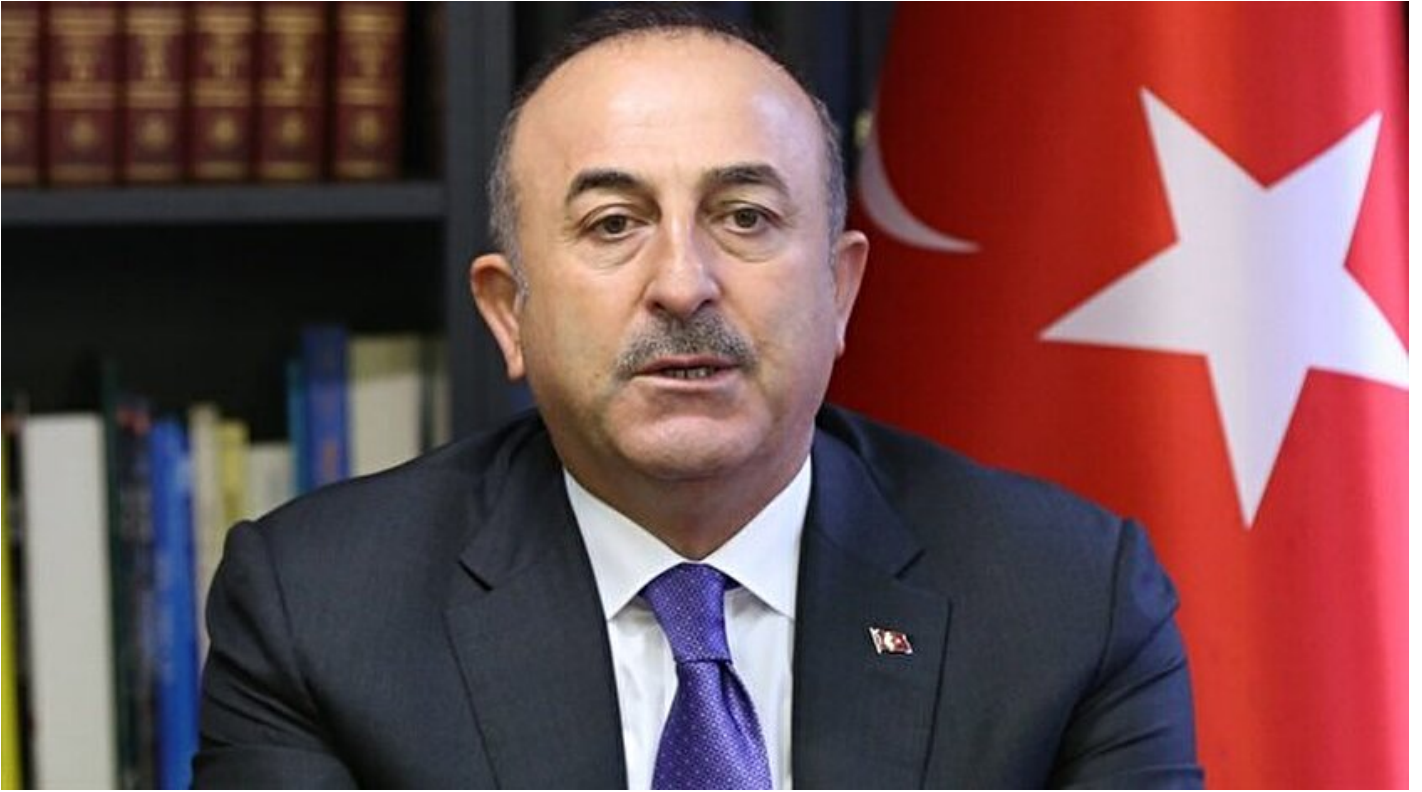
Dışişleri Bakanı Mevlüt Çavuşoğlu