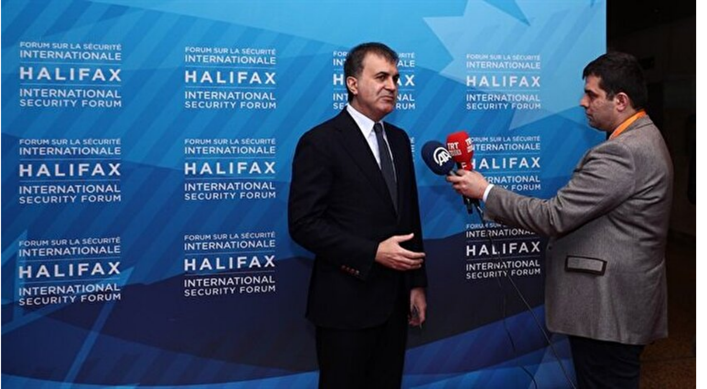
AB Bakanı Ömer Çelik

Haber Merkezi · 19 Kasım 2017, 22:47 · Son Güncelleme: 19 Kasım 2017, 22:49 · AA