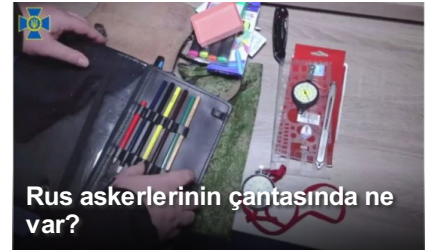
Rus askerlerinin çantasında ne var?