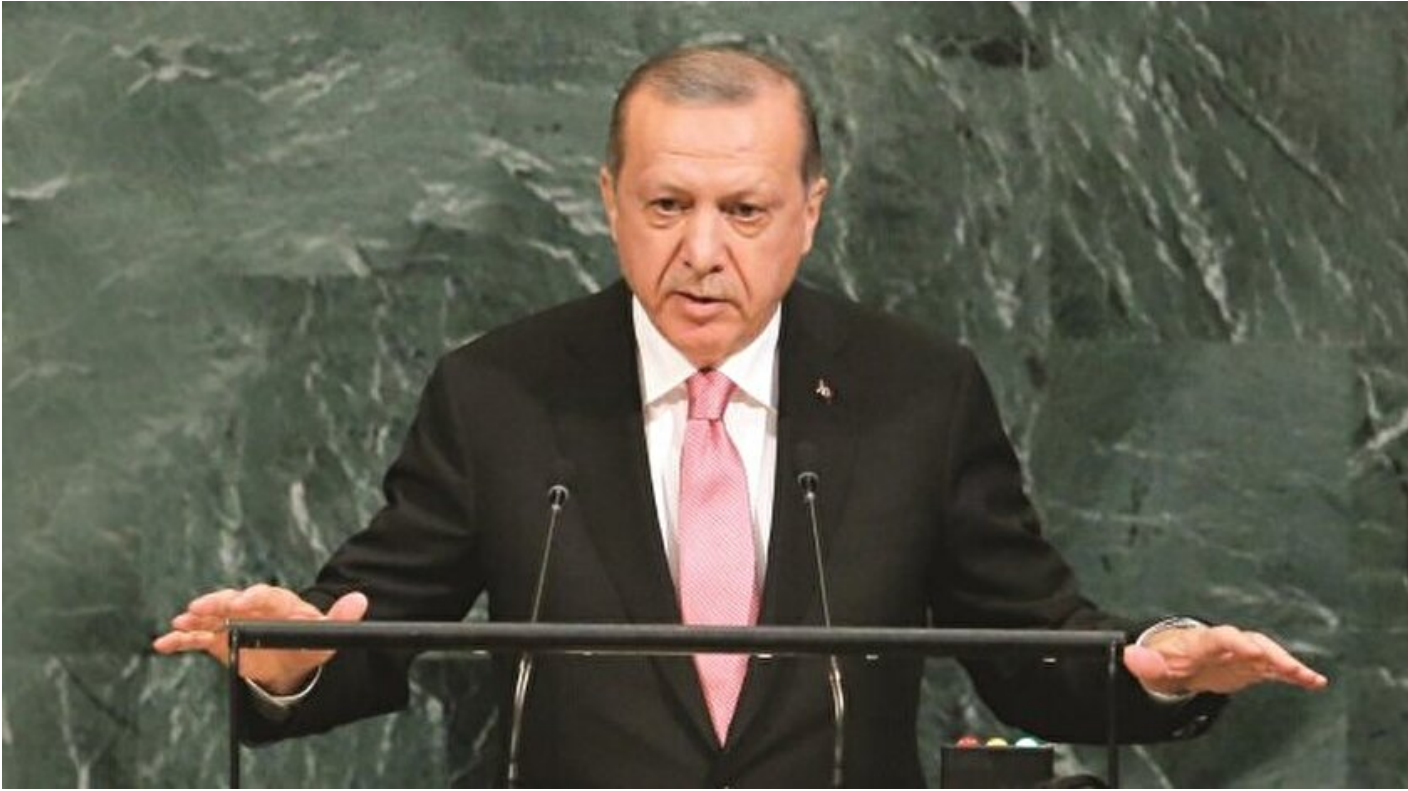
Cumhurbaşkanı Tayyip Erdoğan