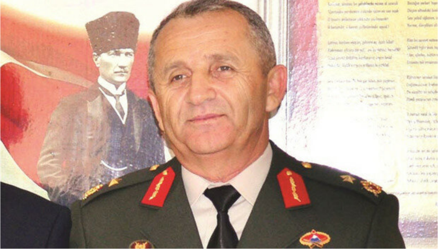
Giresun eski Jandarma Bölge Komutanı Tuğgeneral Mustafa Doğru.

Dođru, GATA'daki tedavisi devam ederken tutuklandı. Önce Sincan Cezaevine konulan Dođru, tedavisinin tamamlanması için Metris Cezaevine konuldu. Dođru hakkındaki davanın hangi mahkemede görüleceđi ise uzun bir zaman aldı.