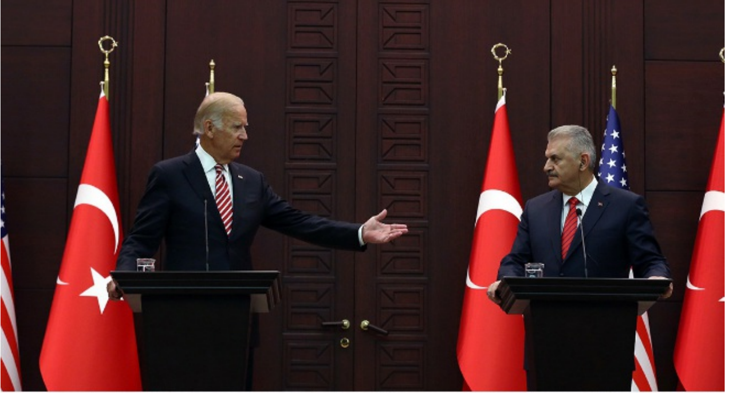
U.S. Vice President Joe Biden speaks to the media after talks with Turkish Prime Minister Binali Yıldırım in Ankara, Turkey, in August.

Haberde Adalet Bakanı Bozdağ'ın "Türk vatandaşları olarak bizler, 241 sivil vatandaşın ölümüne ve 2 bin 194 kişinin yararlanması sebep olmuş, F-16 jetlerinin meclisi bombalamasından bizzat sorumlu, Cumhurbaşkanımıza suikast girişiminde bulunmuş ve aslında tüm bu insanları öldürmüş olan Fetullah Gülen'in serbest olmasına ve ABD'de serbestçe dolaşabilmesine akıl erdiremiyoruz. ABD'den bunu anlamasını istiyoruz, zira hâlihazırda Türk vatandaşlarında artan bir Amerikan karşıtlığı mevcut" dediği aktarıldı.