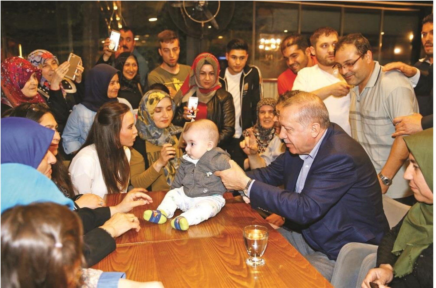
Erdoğan, Balıkesir İl Başkanlığı tarafından düzenlenen iftara katıldı. Binlerce vatandaş ile birlikte orucunu açan Erdoğan, vatandaşların ikram ettiği Türk kahvesini içerek sohbet etti.

"Çıkmış birisi de diyor ki 'Biz Kanal İstanbul'u yaptırmayacağız'. Öbürü diyor ki 'yatırımları durduracağız'. Bir de diyor ki bize, 'senin bütçen boş' diyor. Ya sen anlamazsın ki bu işten. Ekonomi bizim işimiz. Kaynakları çeşitlendirerek bu yatırımları biz yaptık biz. Bunlar ne derse desin biz yatırımlara devam edeceğiz. Diyor ki, 'Erdoğan, Yavuz Sultan Selim Köprüsü'nü yaptı, ben de dördüncüyü yaptırırım.' Ya senin ne haddine? Ne haddine? Bir taraftan şunu yaptırmam, bunu yaptırmam diyeceksin. Öbür taraftan 'ben de dördüncüyü yaptırırım' diyor. 'Milli bütçede para yok' diyorsun. Biz her şeyin bütçedeki parayla yapılmayacağını bilen bir iktidarız. Dünyaya da bunun örneği olduk. Biz geldiğimizde G-20'de miydik ya? Şu anda Türkiye G-20'de."