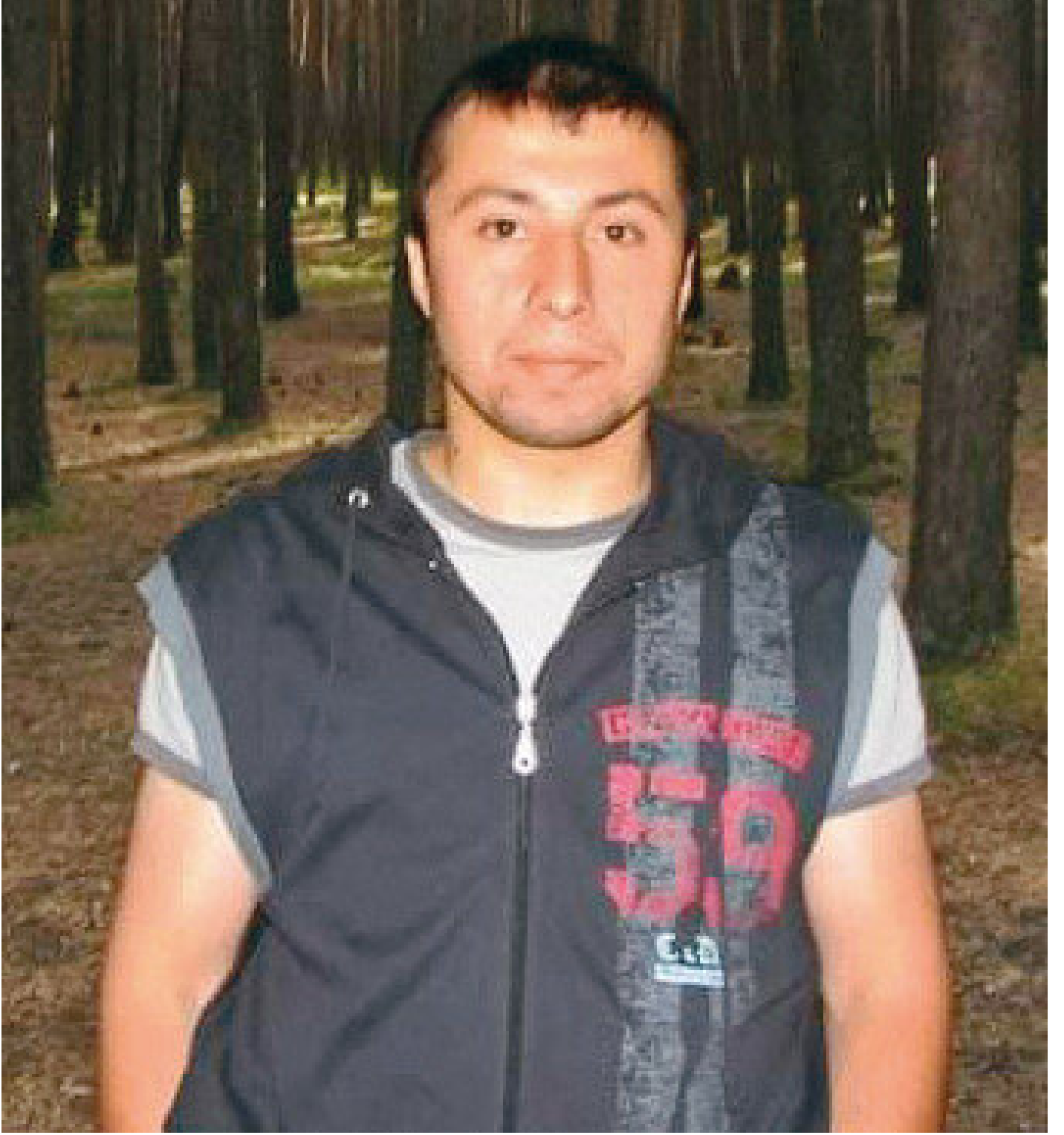
İsmail Hakkı Sarıcaoğlu