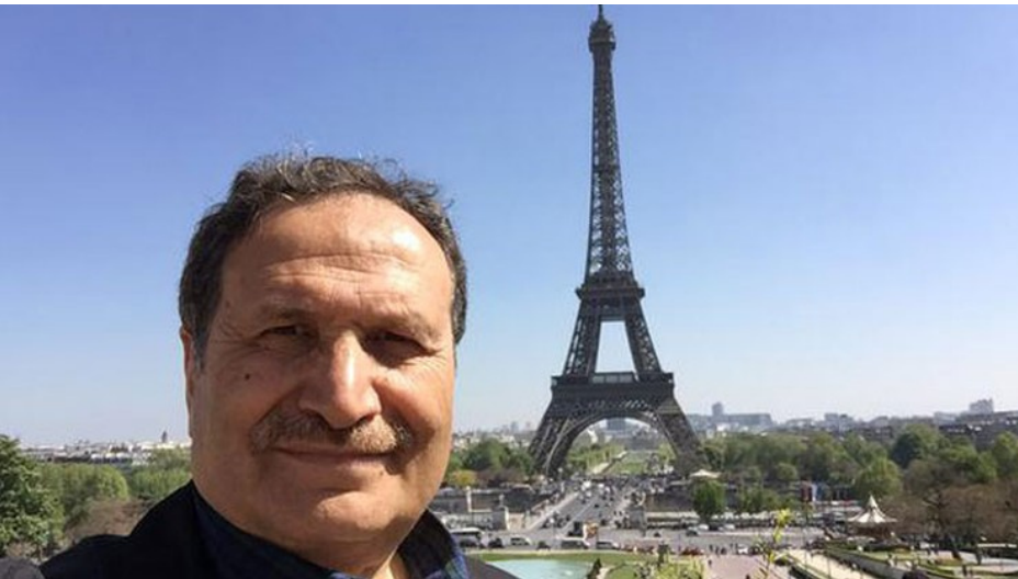
Hakkında gözaltı kararı bulunan

15'i kadın 120 işadımı ve siyasi FETÖ/PDY örgütüne üye olmak, mali destek sağlamakla suçlanıyor. İş adamlarından 79'u gözaltına alındı.