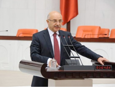
İstifa eden eski AK Parti milletvekiline FETÖ gözaltısı!