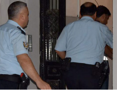
İzmir'de 63 ayrı adreste FETÖ operasyonu