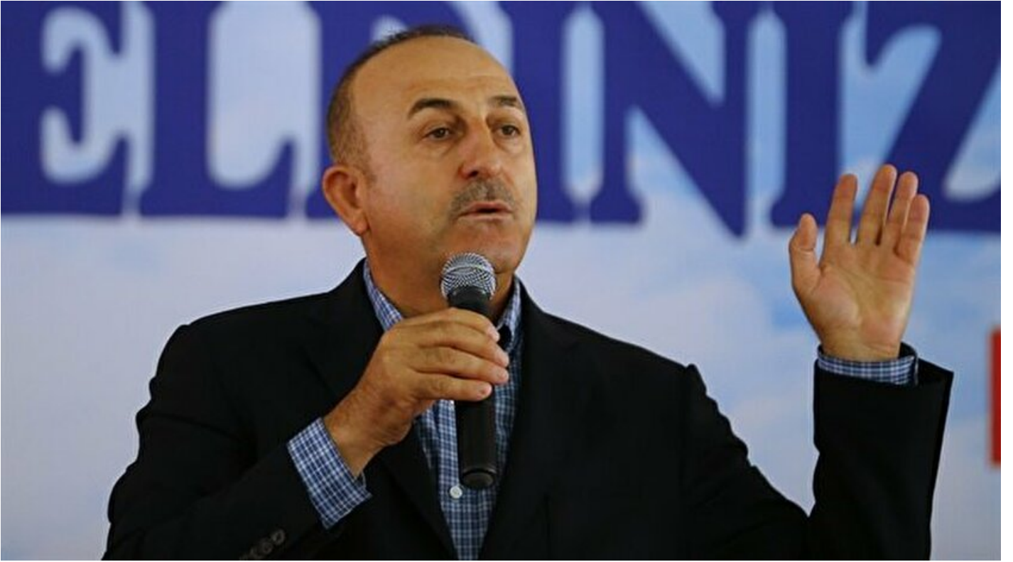
Dışişleri Bakanı Mevlüt Çavuşoğlu.