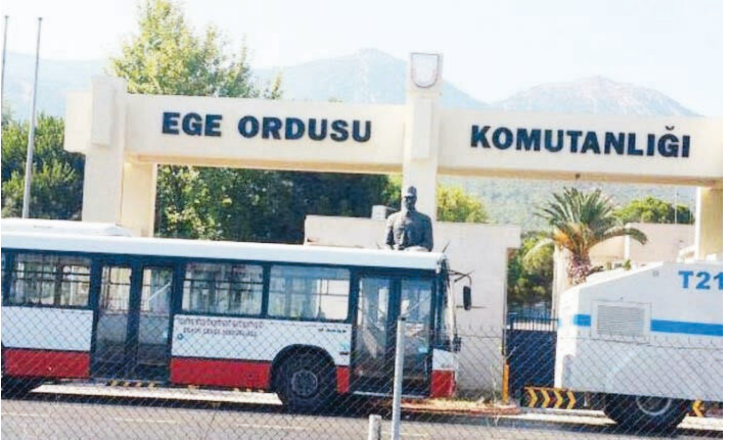
Ege Ordusu Komutanlığı